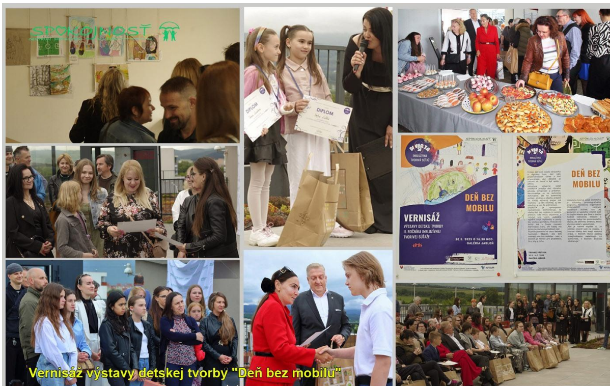
Vernisáž výstavy detskej tvorby "Deň bez mobilu"

Toto podujatie bolo podporené z dotácií Ministerstva školstva, výskumu, vývoja a mládeže v oblasti práce s mládežou, ktoré administruje NIVAM – Národný inštitút vzdelávania a mládeže.