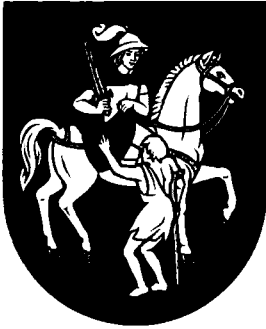
Erb obce Letniče