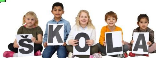
ORGANIZAČNÁ ŠTRUKTÚRA ZŠ Jana Amosa Komenského Sereď

1. stupeň riadenia, 2. stupeň riadenia, 3. stupeň riadenia, 4. stupeň riadenia, 5. stupeň riadenia