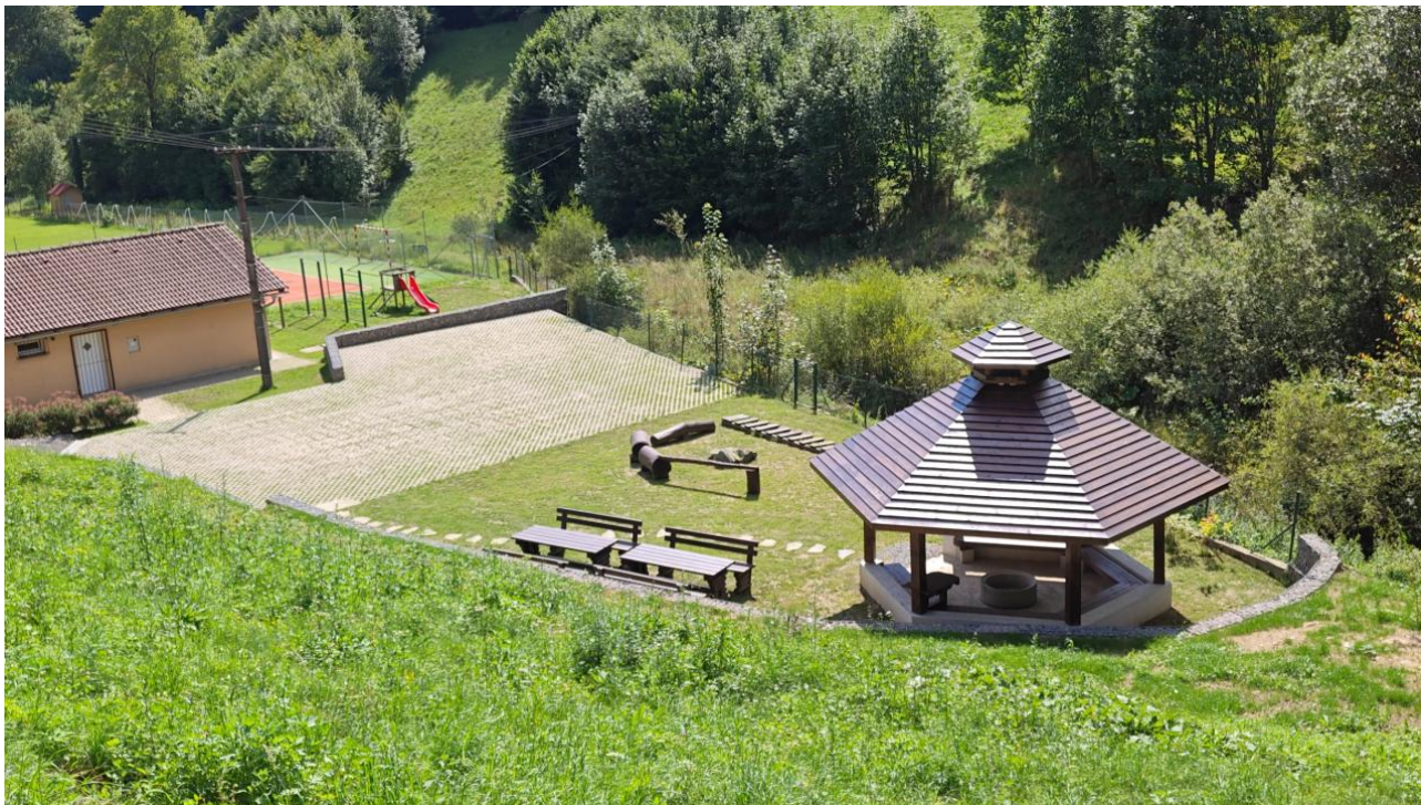
Projekt „Úprava oddychového areálu“