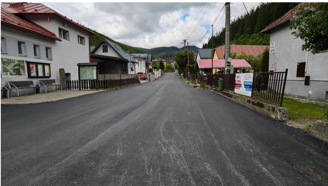
Rekonštrukcia miestnej komunikácie