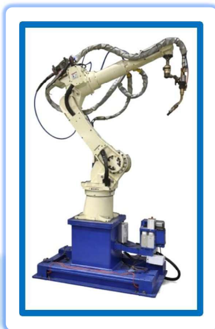
Robotické zvaracie pracovisko OTCFD-V8L P364/2025