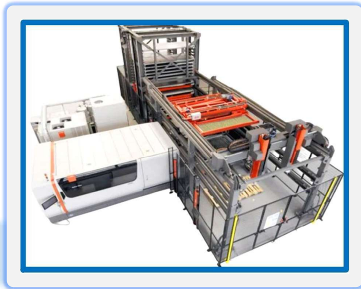
Laser Bystronic ByStar Fiber 3015 F 12000

Robotické zväracie pracovisko OTCFD-V8L P364/2025 – zakúpené pomocou štátnej pomoci vo forme SIH grantu - SIH 3.