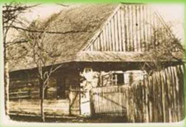
1873-2025 152. výročie postavenia budovy školy