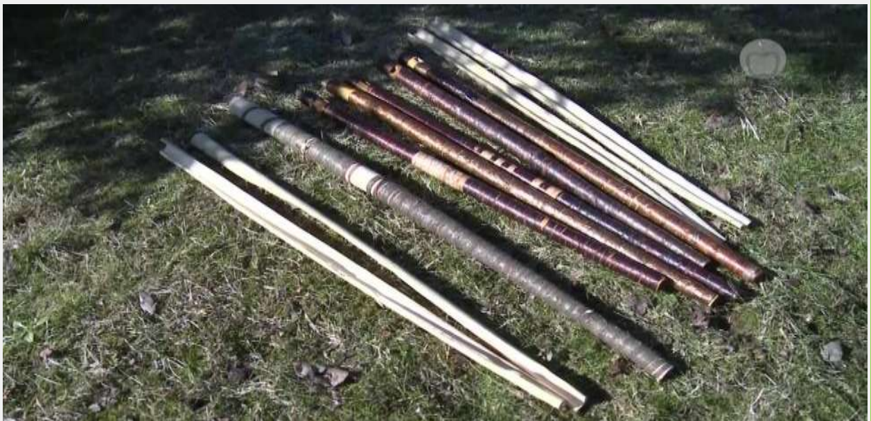
Rífová píšťala z Brvnišťa – chránime dedičstvo pre ďalšie generácie