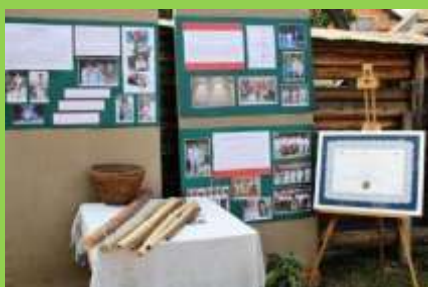
Výstava pre kúpele Nimnica inštalovaná na nádvorí múzea, v súčasnosti v interiéri múzea.