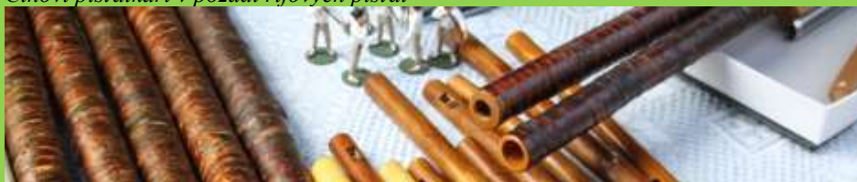
Cínoví píšťalkári v pozadí rífových píšťal