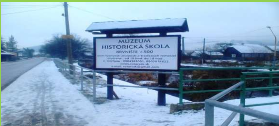
Búrka v obci Brvnište zmietla do rieky Papradnianky našu informačnú tabuľu. Zostala nám už iba fotografia. Hľadáme sponzora na jej obnovenie. Ďakujeme.