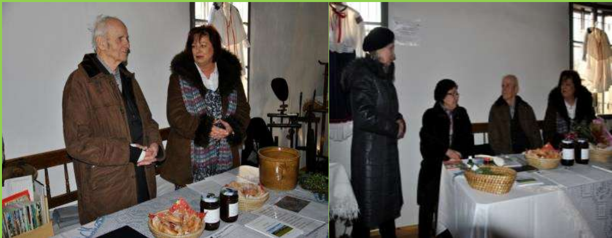
Fotogaléria z uvedenia knihy povestí do života

Obyvatelia sa tešia z vydania povestí o Brvništi a stále žiadajú zabezpečiť dotlač knižočky Štefana Meliša Povesti a príbehy z Brvnišťa s vročením 2016. Pokračujú prípravy na spracovaní 2. zväzku povestí a na druhom vydaní knižočky.