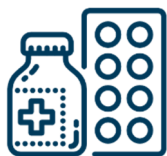
Veterinári & Lekárne