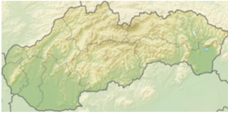
Poloha obce na Slovensku