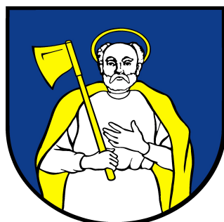
Obr. č. 2: Erb obce Tvarožná

Svätý Matej apoštol je patrónom farského rímskokatolíckeho kostola.