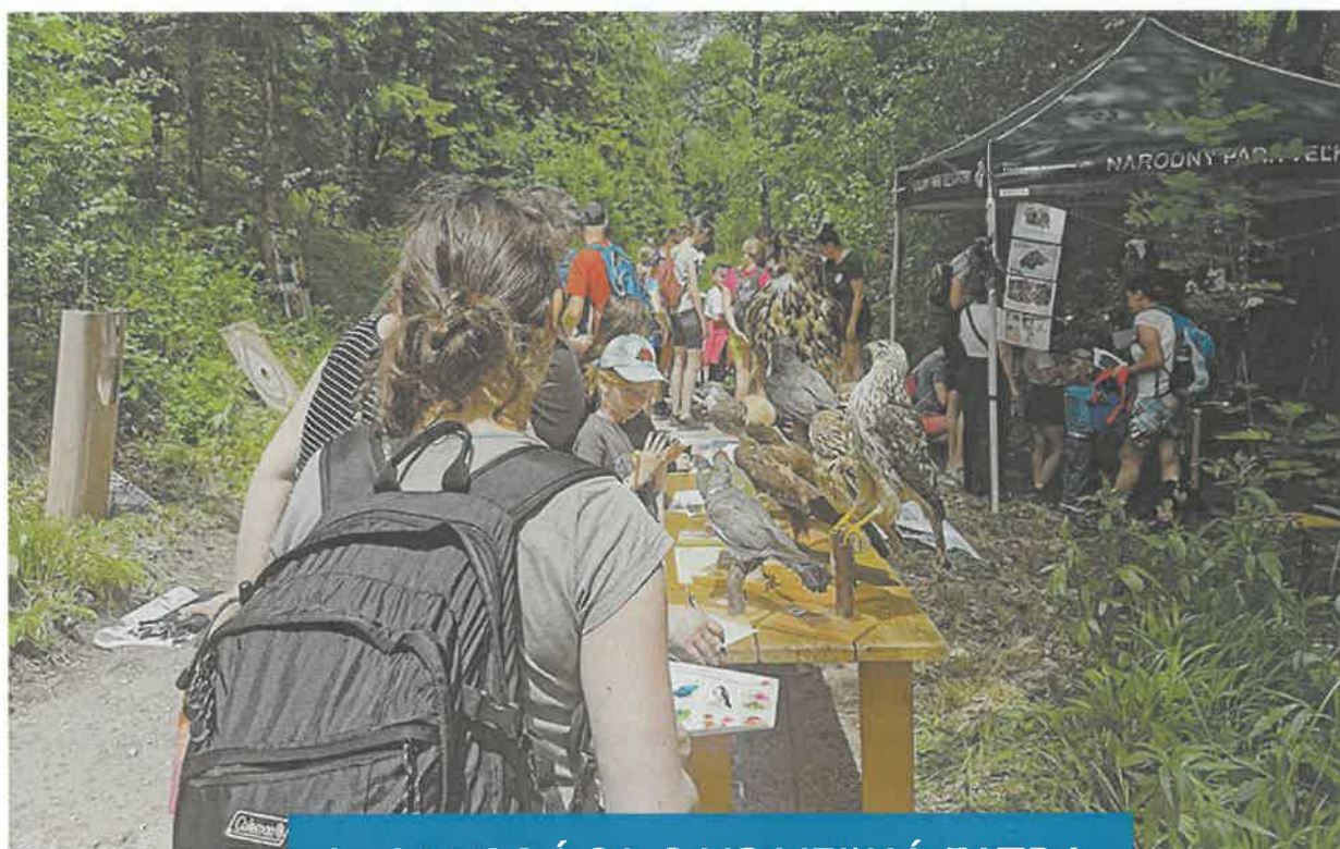
SPOLUPRÁCA S NP VEĽKÁ FATRA.

V júli sme podporili ďalší ročník festivalu Hory a Mesto Martin – Noc horských filmov. I na ňom sme propagovali pitie vody z vodovodu, Necpalský prameň a Turvod.