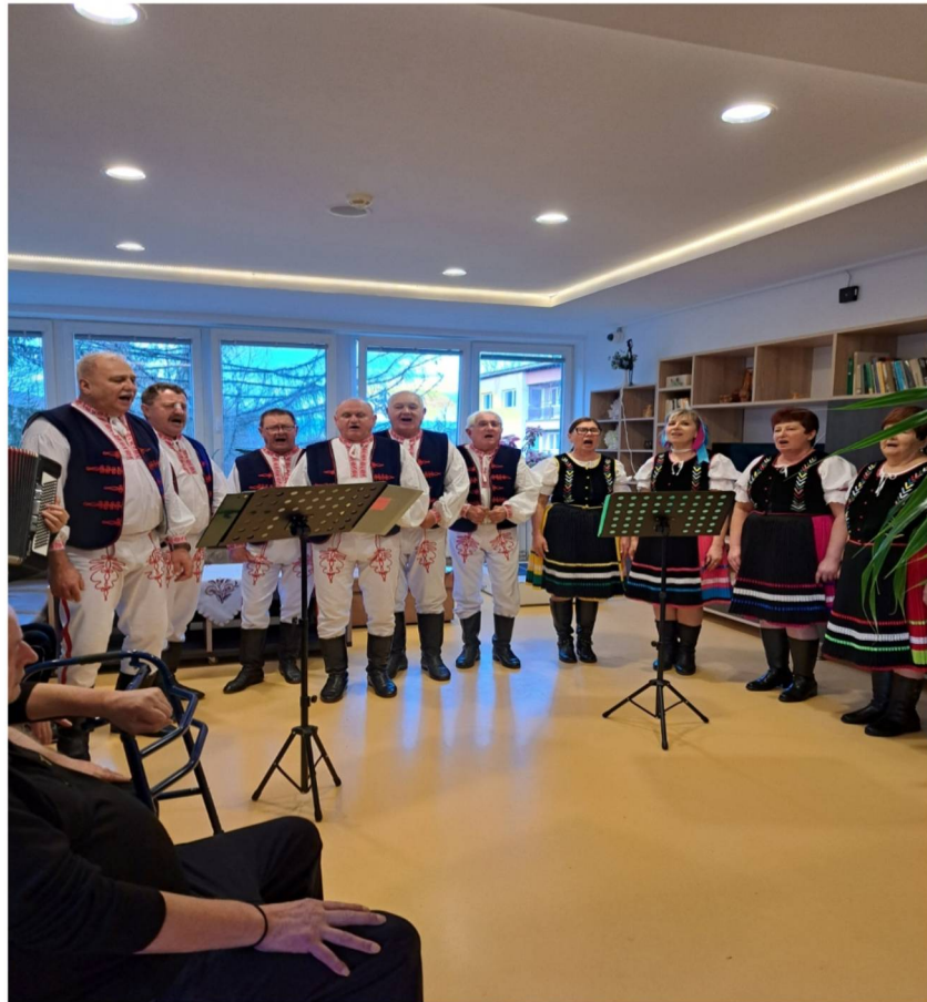
Výročná správa ÚSVIT- ML, n. o., rok 2025