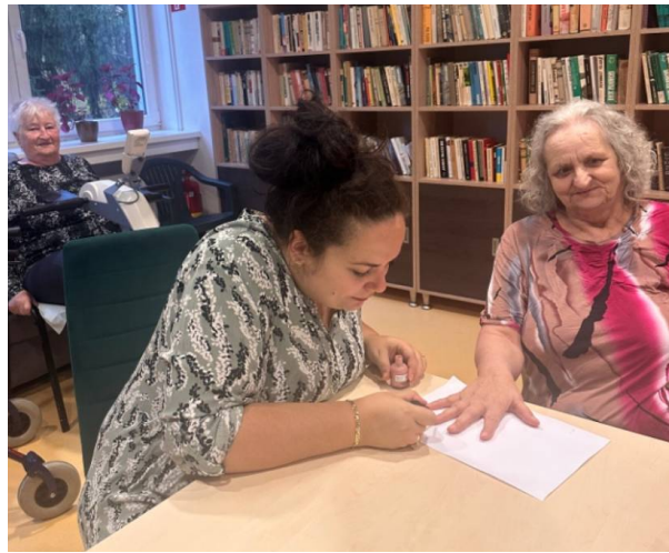
Skrášľovací deň v podobe farbenie vlasov, líčenia a lakovania nechtov