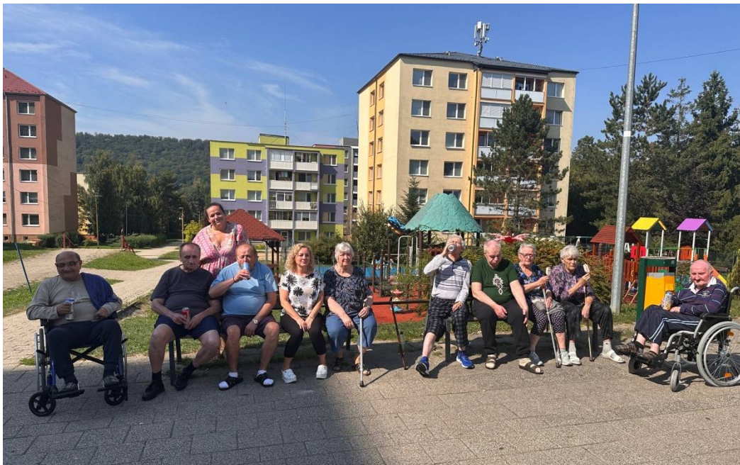
Oddychové prechádzky v blízkosti zariadenia