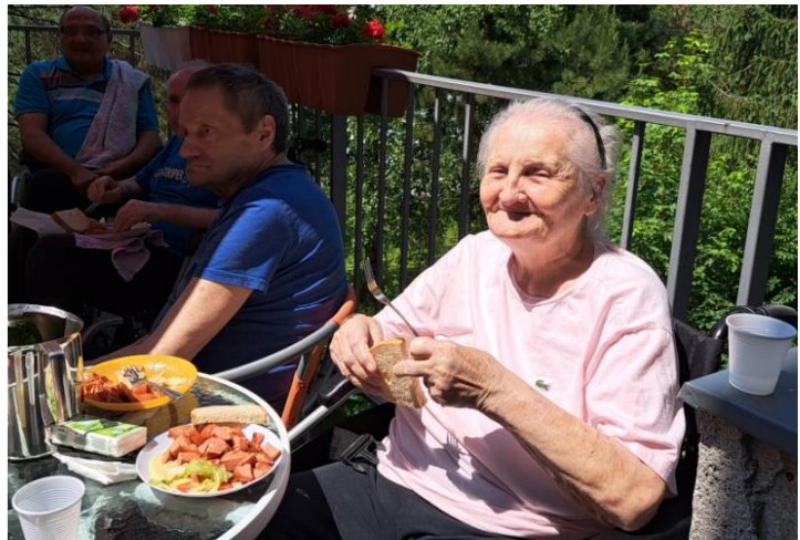
Grilovanie na terase