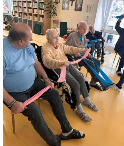
Pohybové skupinové cvičenia v spoločenskej miestnosti