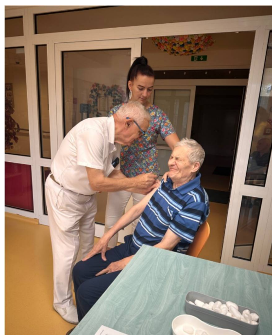
Očkovanie prijímateľov proti chrípke