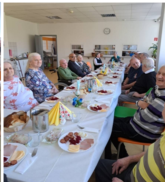
Veľká noc s otcom duchovným