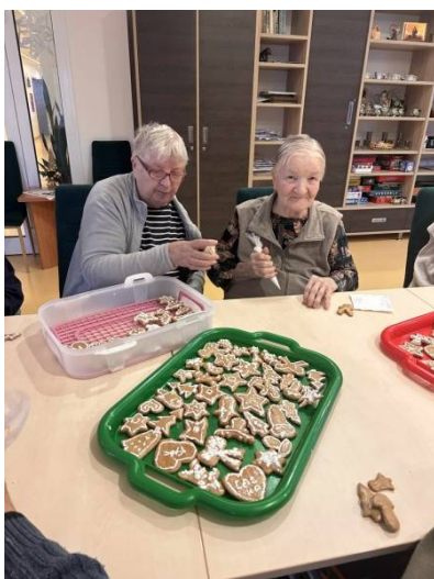
Nácvik jemnej motoriky: vykrajovanie medovníkov, zdobenie medovníkov