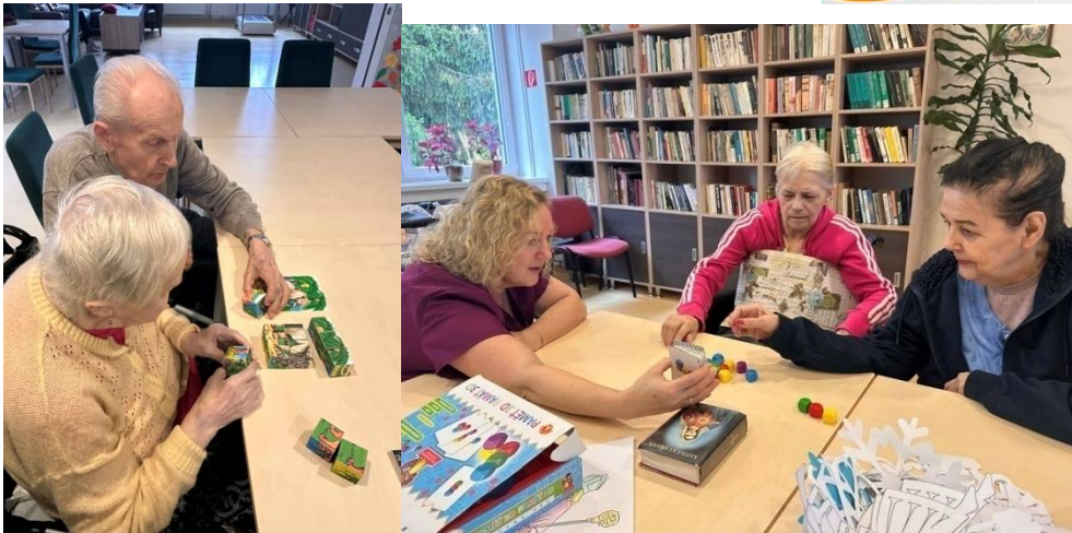
Precvičovanie pamäte: skladanie kociek podľa obrázka, skladanie kociek podľa predlohy.