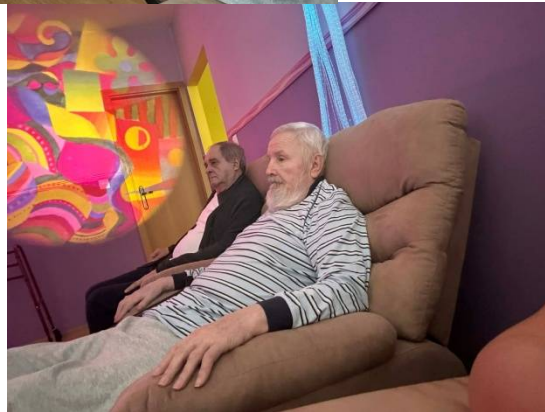
Oddychovanie v relaxačnej miestnosti Snoezelen