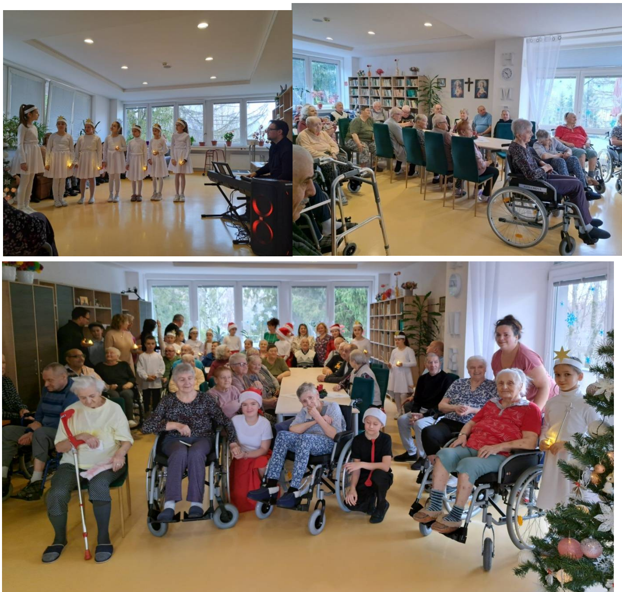
Vianočné vystúpenie žiakov zo ZŠ Komenkého

Veľké poďakovanie venujeme folklórnemu súboru Zaruba z obce Ňagov za krásne vianočné vystúpenie s pásmom Koleda, ktorým priniesli našim prijímateľom spomienky a pravú vianočnú atmosféru. Taktiež aj pedagógom a žiakom základných škôl na ulici Duchnovičovej a Komenkého, ktorí si pre našich starkých pripravili vystúpenia plné spevu a tanca. Pre detičky sme mali pripravené balíčky, na ktorých sa podieľali pri výrobe aj naši prijímatelia (vyrábali vianočných škriatkov z vlny).