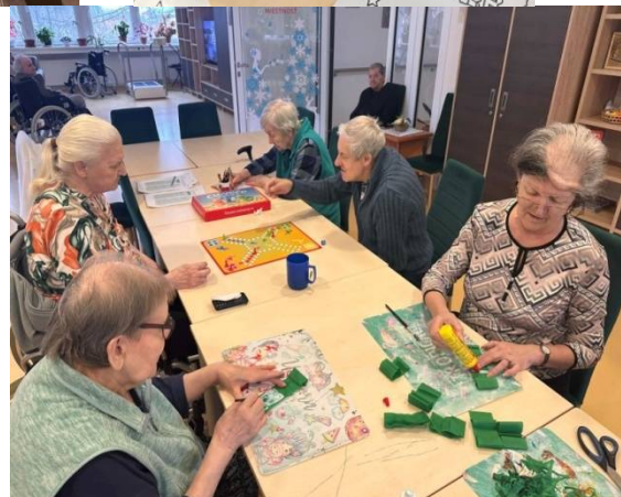
Nácvik jemnej motoriky: farbenie, práca s lepidlom, , vysádzanie sadeníc, riešenie pamäťových úloh, hranie spoločenských hier, strihanie, maľovanie.