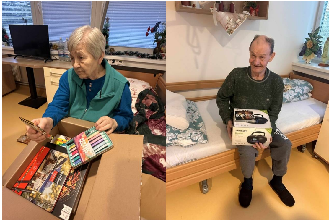
Darčeky pre našich prijímateľov