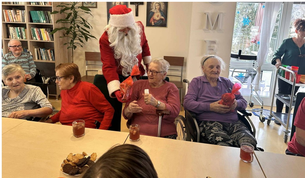
Rozdávanie balíčkov od Mikuláša