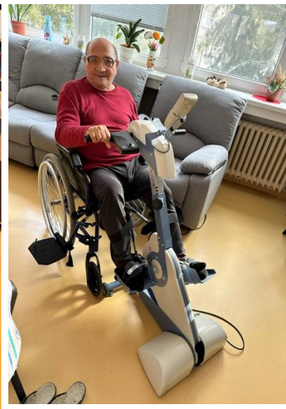
Cvičenie horných a dolných končatín na liečebnom pohybovom stroji