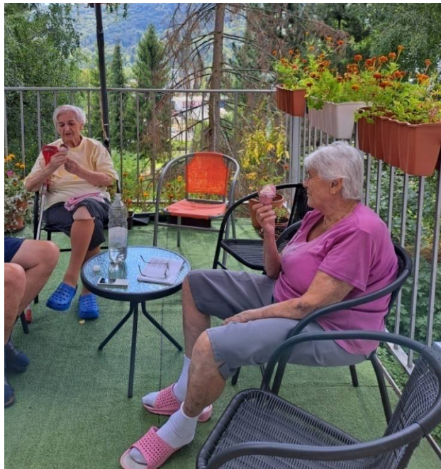
Pochutnávanie si na zmrzline