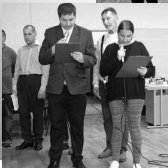
... a iné