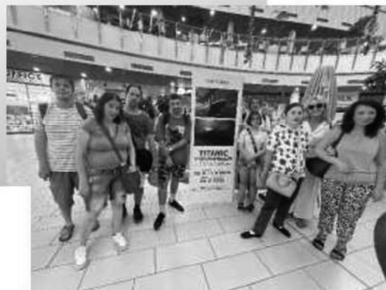
OC OPTIMA - „Titanic v spomienkach“