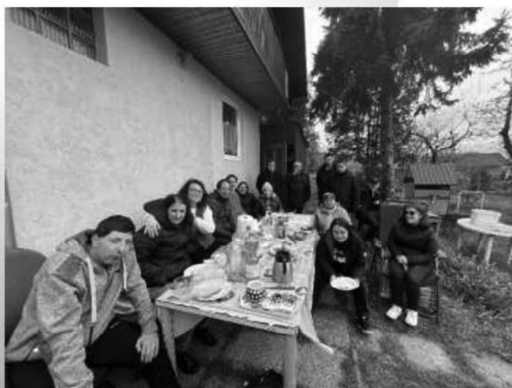
Varenie guľášu v záhradkárskej oblasti nad Kalváriou