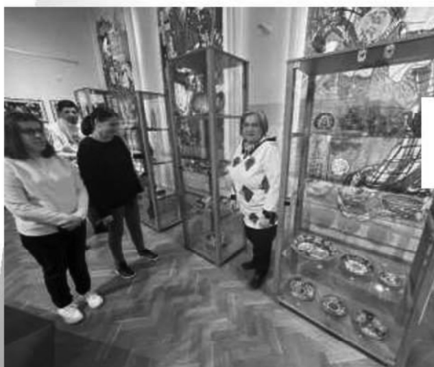
Vsl. Múzeum - „Japonskí samuraj“