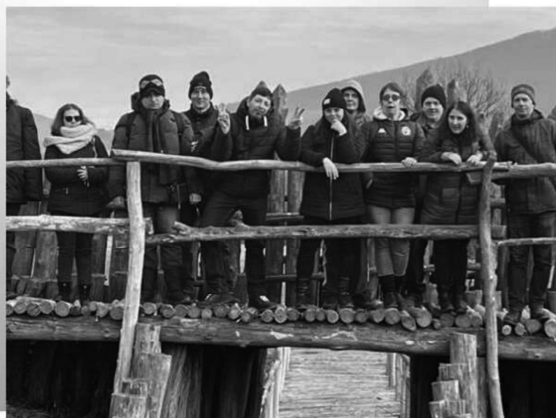
Nížná Myšľa - Archeoskanzen