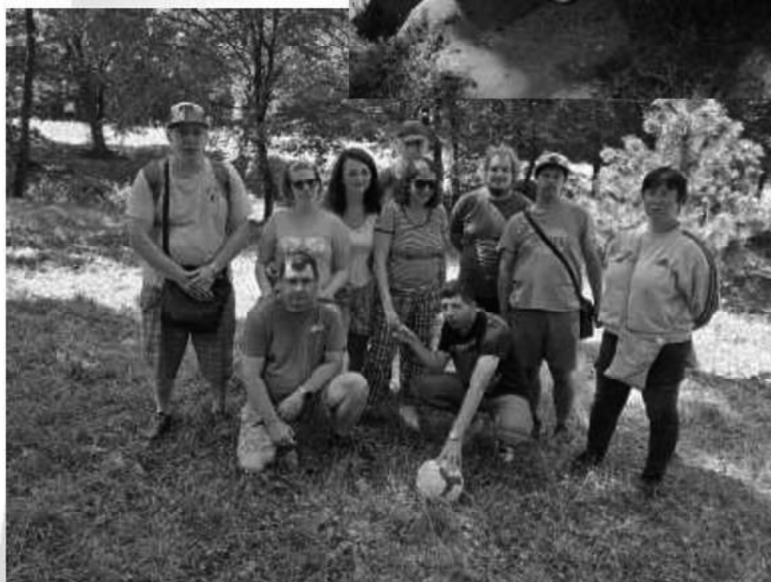
Opekačka na Bankove