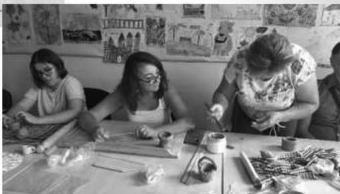
Projekt Nadácie Pontis