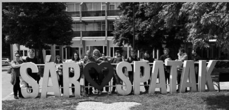
Maďarsko - Sárospatak