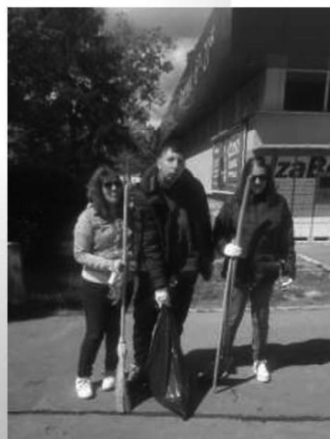
„Deň čistého KVP“