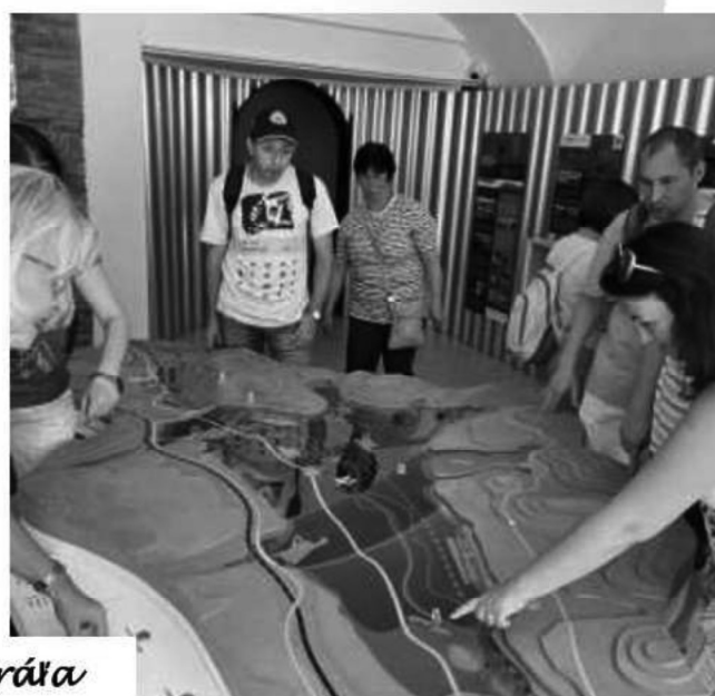
Liptovský Mikuláš - Múzeum J. Kráča výstava „Príbeh vody“