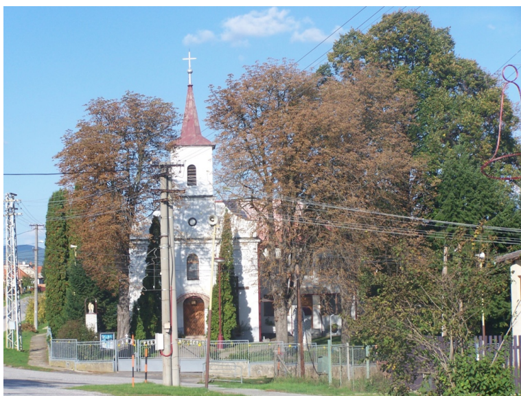
Kostol sv. Juraja v obci