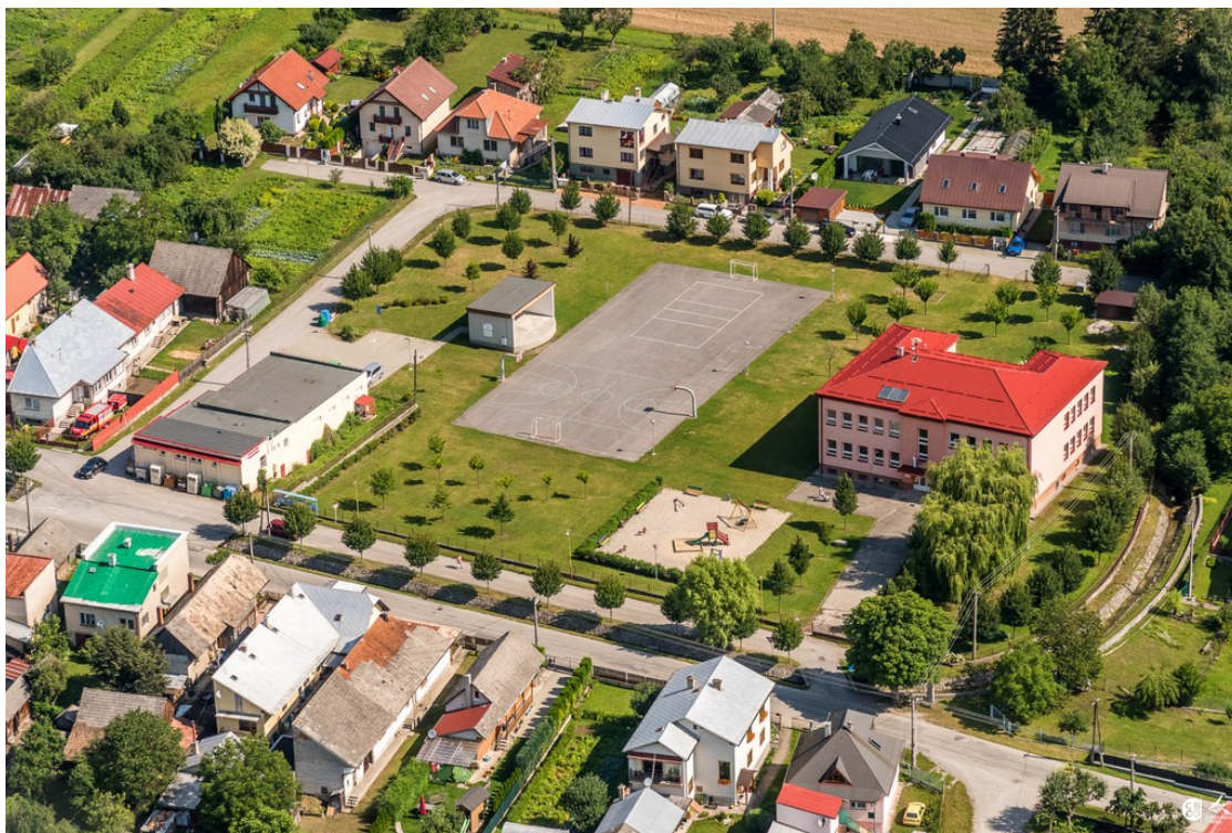
Budova Základnej školy