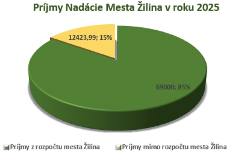
Graf 1 Príjmy nadácie za rok 2025

V roku 2025 Nadácia Mesta Žilina získala silnú podporu v podobe materiálnej pomoci od: