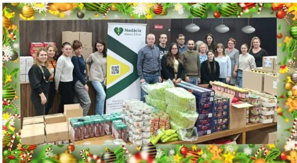
Vianočná potravinová pomoc 2025