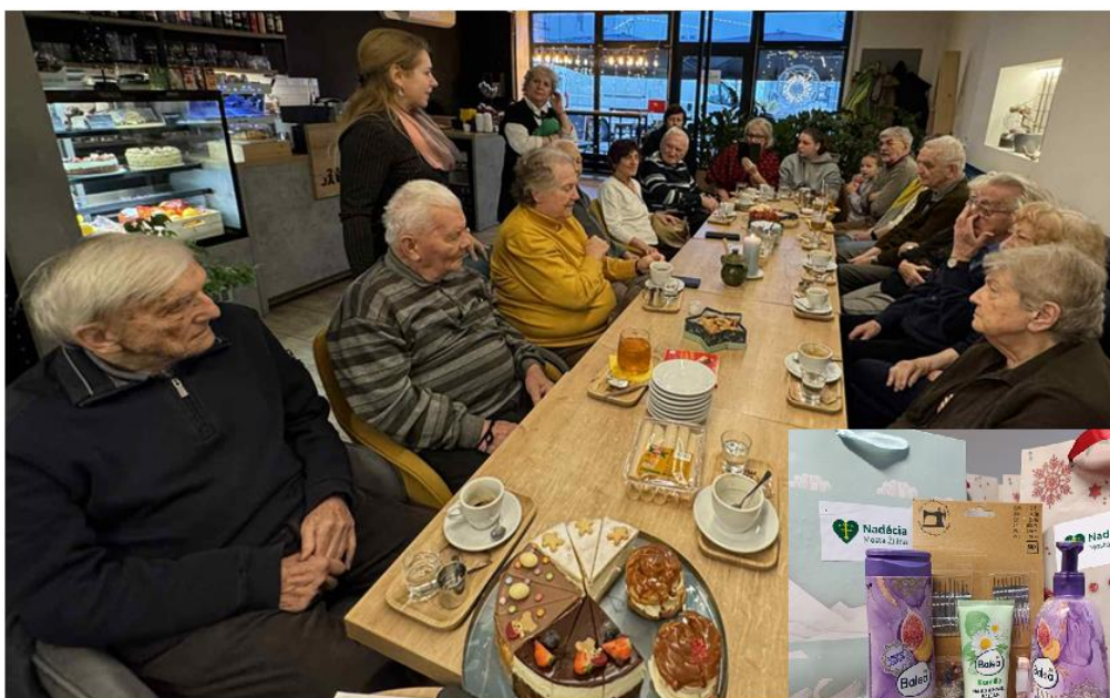
Vianočné posedenie so seniormi

Vianočné posedenie so seniormi - aj v roku 2025 pripravila nadácia tradičné Vianočné posedenie so seniormi z mesta Žilina. Podujatie sa nieslo v duchu príjemnej sviatočnej atmosféry, spoločných rozhovorov a vzájomnej úcty. Každý zo seniorov si odniesol aj malý vianočný darček ako prejav pozornosti a poďakovania.