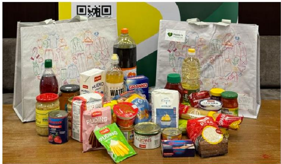
Veľkonočná potravinová pomoc 2025

Potravinová pomoc - V uplynulom roku sme sa intenzívne zameriavali na priamu materiálnu pomoc rodinám, ktoré sa ocitli v náročnej životnej situácii. Prostredníctvom dvoch kľúčových akcií – Veľkonočnej a Vianočnej potravinovej pomoci – sme celkovo podporili 241 rodín so zdravotným znevýhodnením a rodiny zo sociálne znevýhodneného prostredia. Naším cieľom bolo priniesť do domácností nielen potrebné potraviny, ale aj pocit solidarity počas najvýznamnejších sviatkov roka. Táto pomoc bola realizovaná aj vďaka štedrosti našich partnerov. Súčasťou balíkov boli produkty od spoločností Ryba Žilina spol. s r.o. a Kofola, a.s., ktoré nadácia získala darom.