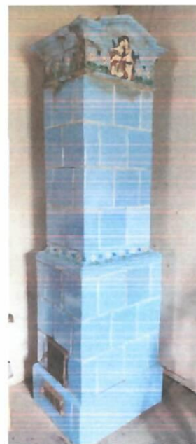
Obr.č.1: Historické črepené kachle z Domu ľudového

Evanjelický kostol: Tolerančný evanjelický kostol bol postavený v r. 1785, po vydaní Tolerančného patentu cisárom Jozefom II. Kostoly postavené v duchu Tolerančného patentu museli spĺňať určité kritéria. Teda, nesmeli mať vežu a vchod do kostola z hlavnej ulice. Dnes je už kostol súčasťou obce, ale v čase, keď sa staval, stál za dedinou. Od doby svojho vzniku prešiel viacerými opravami. Podľa záznamu na klenbe bol rekonštruovaný v r. 1930, potom v r. 1977 a posledná generálna oprava bola vykonaná v r. 2013. Postupne bola vymenená strecha, urobená nová elektroinštalácia, vymenené okná, vchodové dvere, budova bola odvodnená zvonku aj zvnútra. Následne boli urobené nové omietky, maľovky zvonku aj zvnútra a nová podlaha. Kostol má vyrobené nové lavice. Od r. 2013 v etapách prebieha aj reštaurovanie mobiliáru - zreštaurovaný je oltár, kazateľnica a v pláne je aj reštaurovanie empyry. Spomínané reštaurátorské práce boli vykonané s podporou fondu z MK SR Obnovme svoj dom so spoluúčasťou cirkevného zboru. V r. 2020 cirkevný zbor vykonal generálnu opravu organa. Zreštaurovaním empyry bude komplet obnovená vzácna národná kultúrna pamiatka nielen pre domácich veriacich, ale aj pre turistov, ktorí budú objavovať vzácne dedičstvo predkov na Gotickej ceste, kde sa nachádza aj náš kostol.