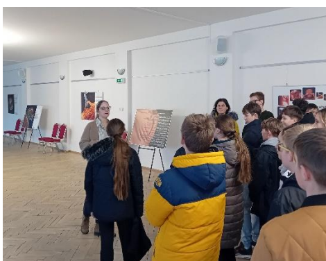
Edukačná výstava: Život pred narodením

Osvetové aktivity sme realizovali aj prostredníctvom účasti na festivaloch a verejných podujatiach, konkrétne na edukačnej výstave Život pred narodením pre žiakov základných a stredných škôl v meste Stropkov 27. januára 2025, na podujatí Živé Račko 8. septembra a na Ženskej konferencii – Vyvolená 15. novembra.