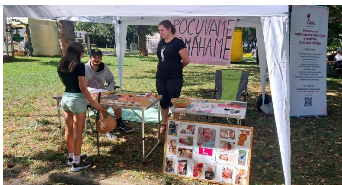
Stánok Poradne ALEXIS: Živé Račko