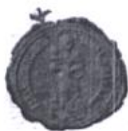
Pečať „mestečka“ Slovenská Ves