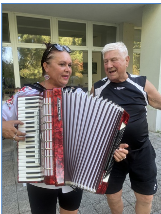
Harmonika pri grile, aj s tou troškou promile.