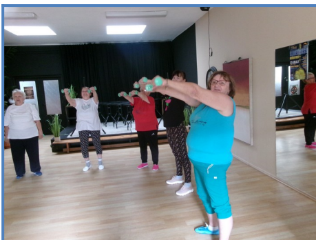
Kondičné cvičenie – „Že prospejú kmity, nie sú iba mýty.“

Scorpioni Nitra – oddiel tu odohral vo víkendových termínoch 6 zápasov celoštátnej ligy Asociácie nevidiacich a slabozrakých športovcov, aktívni hráči klubu absolvujú aj svoje tréningy.