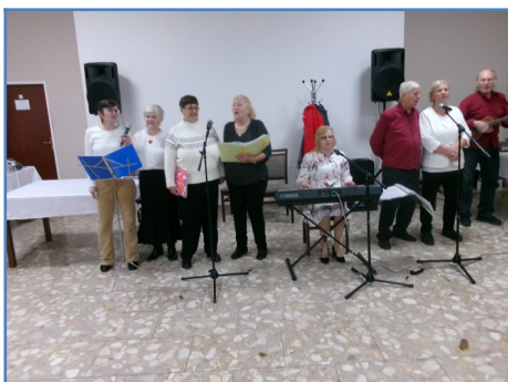
Radost'- „Nie je im už dvadsaťpäť, ale majú radi svet.“