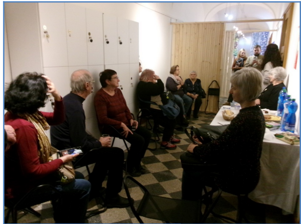
Teraz sa tu stretli všetci zúčastnení v tejto veci