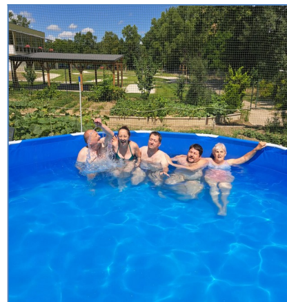
Úžasné sú zvody vody