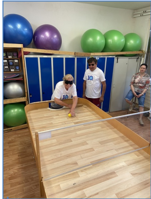
Hrkajúca loptička, netrafi, kto nevyčká.