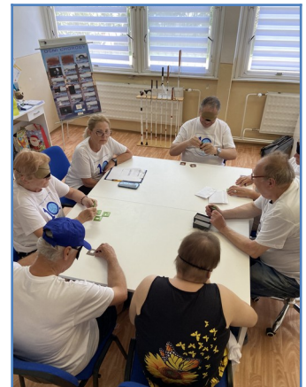
Quardo – „Je to hra stolová, nervy maj vždy z olova.“