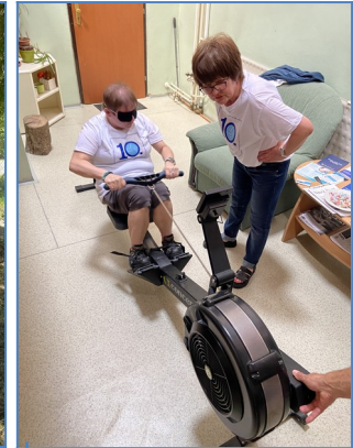
Kým sadneš na trénažér, tak sa predtým nenajedz.