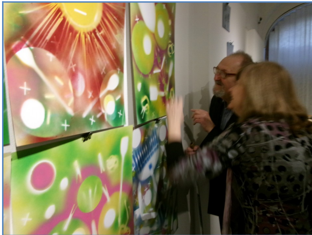
Záverečná výstava svedectvo tu vydáva