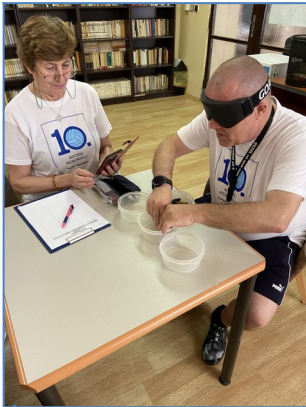
S vycibreným hmatom, vytriediš aj atóm.