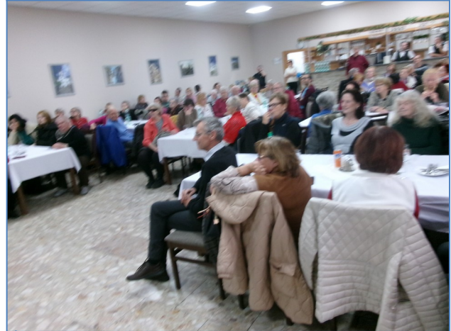
My sme vďačné publikum, oceníme hercov um.