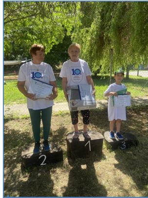
Každý zmysly upne na víťazstvo stúpne.