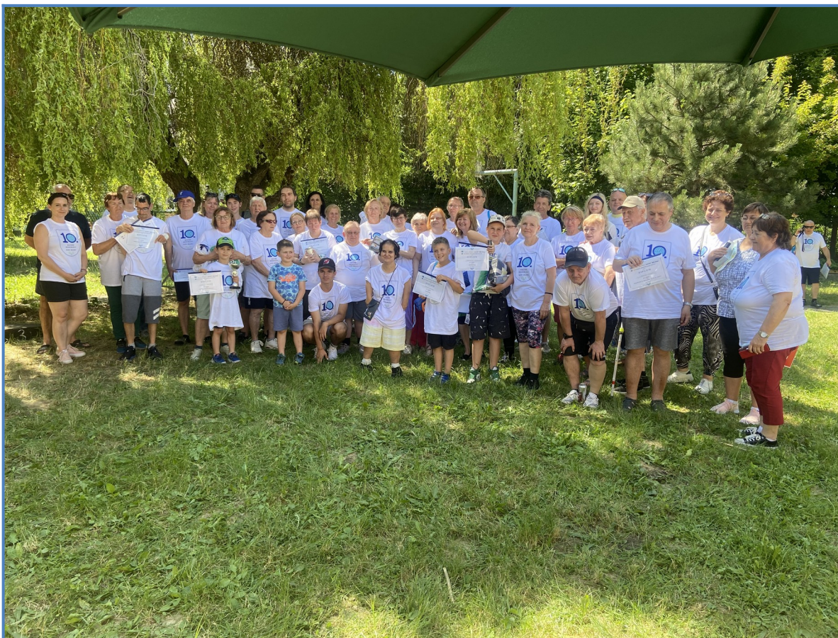
Účastníci 10. ročníka Memoriálu Zlatky Bielickej

Stredisko integračných aktivít pre zrakovo a viacnásobne postihnutých ľudí