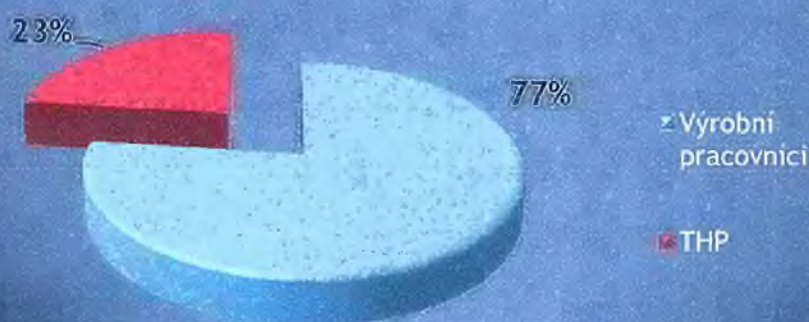
Rozdelenie pracovníkov LOKO podľa zaradenia