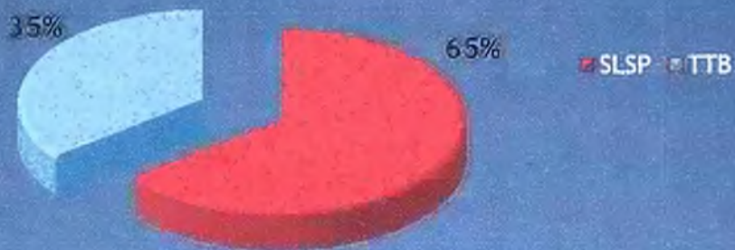
Graf podielu bánk na financovaní ŽOS Zvolen, a.s. v roku 2025