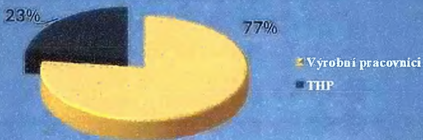
Rozdelenie zamestnancov ŽOS Zvolen, a.s.