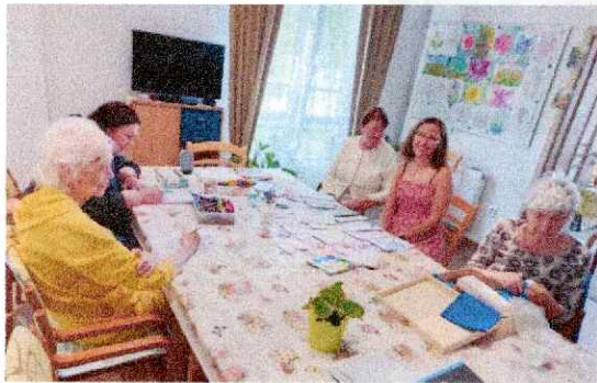
Obr. 16 Láska kvitne v každom veku