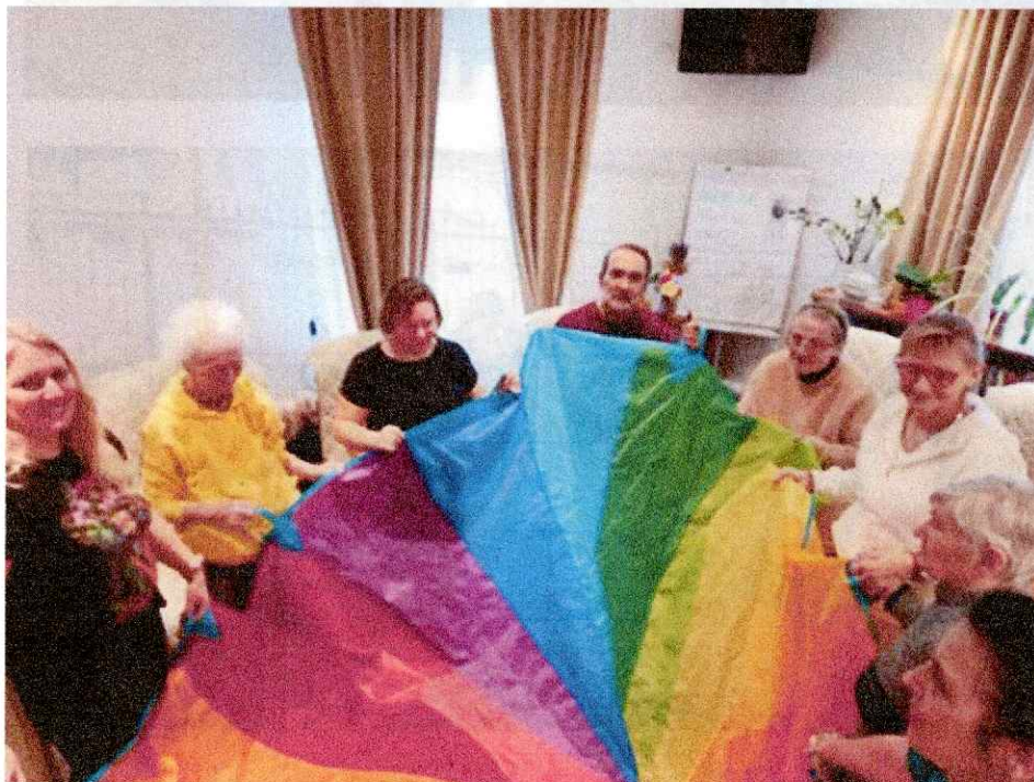
Obr. 18 Odborná prax počas Opatrovateľského kurzu