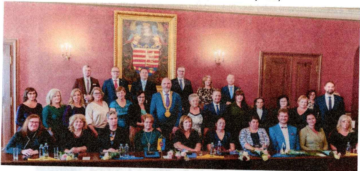
Obr. 1 „Srdce pre Košice“ 2025 - ocenenie koordinátorky opatrovateľskej služby