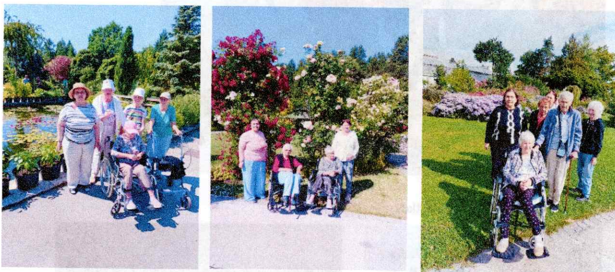
Obr. 3-5 Návštevy Botanickej záhrady UPJŠ v Košiciach

Záujmová činnosť a rozvoj pracovných zručností sa realizovali podľa individuálnych plánov klientov, najmä využitím techník s prvkami arteterapie, muzikoterapie, biblioterapie a gardenterapie. Rozvíjali sa aj zručnosti spojené s pečením, tematicky zamerané na sviatky a ročné obdobia (Obr. 6-15).