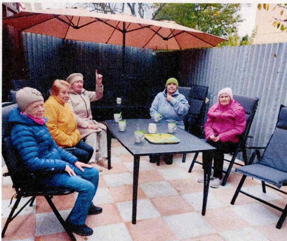
Obr. 2 Zrekonštruovaný zadný dvor Diakonického centra pre vonkajšie aktivity

Vďaka finančnej podpore od partnerskej cirkvi vo Württembersku - Hoffnung für Osteuropa , sme začali realizovať 2. etapu rekonštrukcie a vytvárať podmienky pre rozšírenie činnosti nášho centra: vypracovali sme architektonickú štúdiu a návrh rozpočtu, zrekonštruovali sme zadný dvor a nakúpili potrebné materiálne vybavenie (Obr. 2).