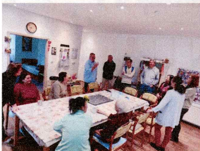
Obr. 19 Návšteva profesorov z USA