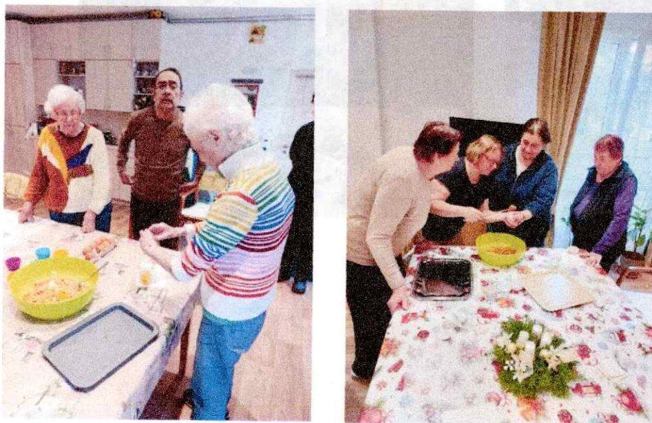
Obr. 6-7 Reminiscenčné pečenie

Záujmová činnosť a rozvoj pracovných zručností sa realizovali podľa individuálnych plánov klientov, najmä využitím techník s prvkami arteterapie, muzikoterapie, biblioterapie a gardenterapie. Rozvíjali sa aj zručnosti spojené s pečením, tematicky zamerané na sviatky a ročné obdobia (Obr. 6-15).