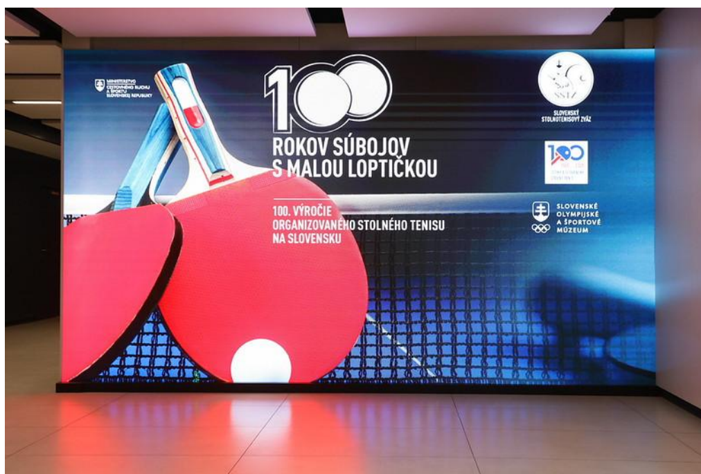
Slávnostná výstava „100 rokov súbojov s malou loptičkou“ pri príležitosti osláv 100. výročia organizovaného stolného tenisu na Slovensku

Významným momentom osláv bolo aj vydanie prvej slovenskej poštovej známky venovanej stolnému tenisu, ktorá vznikla v spolupráci so Slovenskou poštou a Slovenským olympijským a športovým výborom. Slávnostný krst známky sa stal symbolickým pripomenutím storočnej tradície organizovaného stolného tenisu na Slovensku.