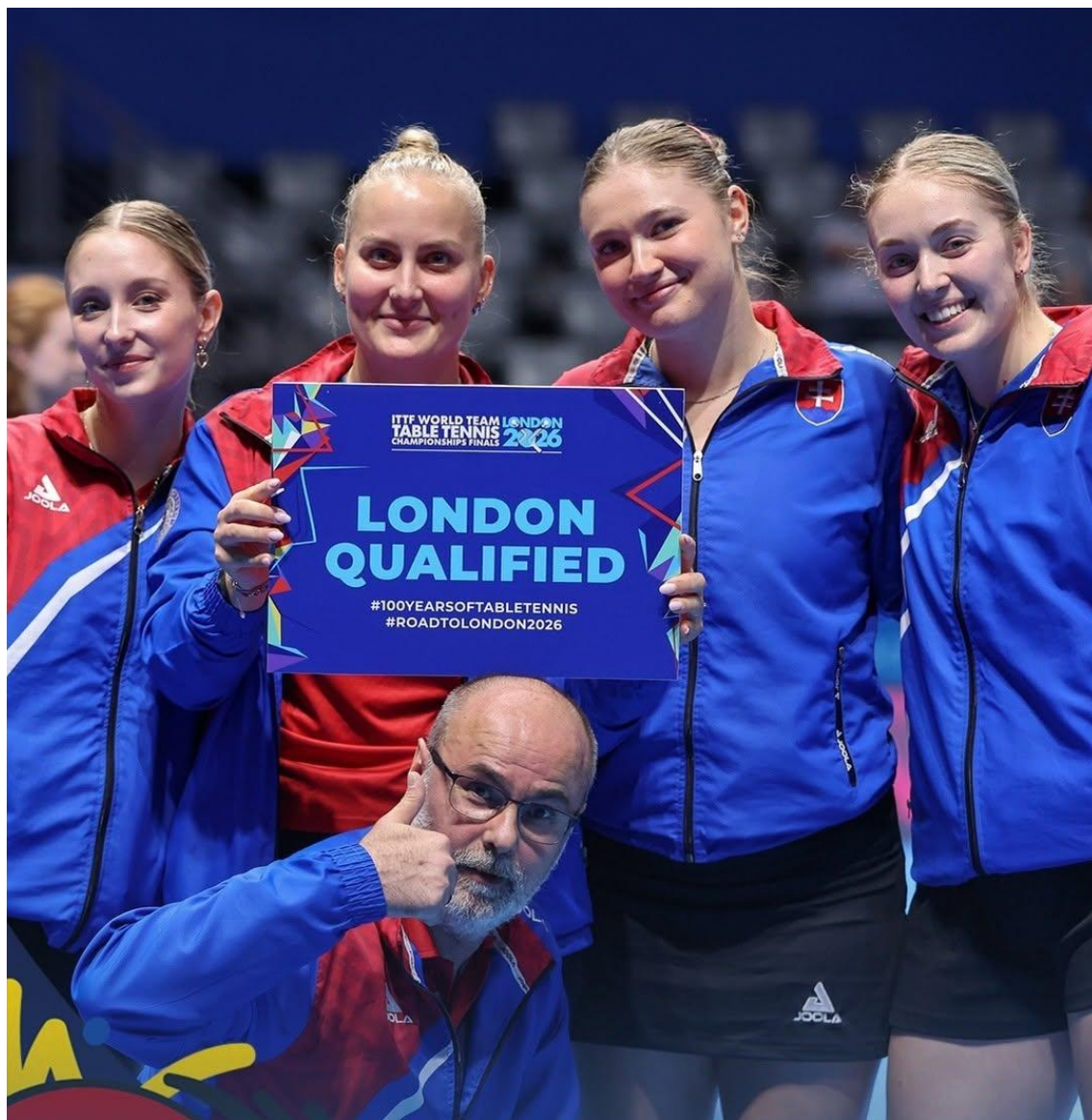
Slovenské družstvo žien na Majstrovstvách Európy družstiev 2025 v Zadare po postupe na MS družstiev 2026 v Londýne.