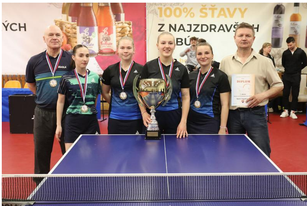
ŠKST Topoľčany – majsterky Slovenska družstiev žien v sezóne 2024/2025