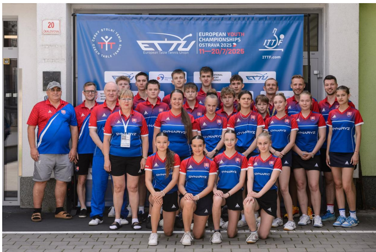
Spoločná fotografia slovenskej výpravy na Majstrovstvách Európy mládeže 2025 v Ostrave