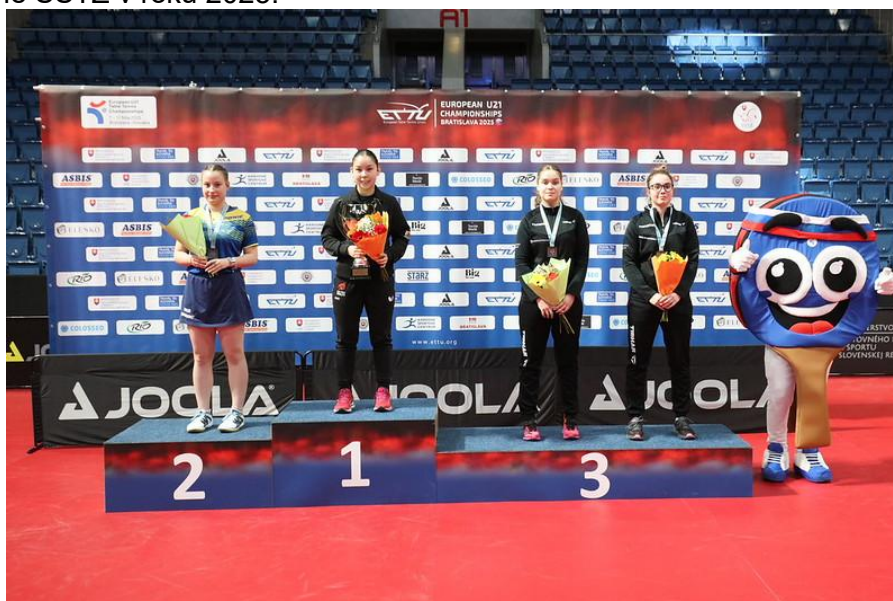
Medailistky dvojhry žien na Majstrovstvách Európy do 21 rokov 2025 v Bratislave.

Významnou udalosťou bolo usporiadanie Majstrovstiev Európy do 21 rokov v Bratislave, 07.-11.5.2025, ktoré patrili medzi najvýznamnejšie medzinárodné športové podujatia organizované SSTZ v roku 2025.