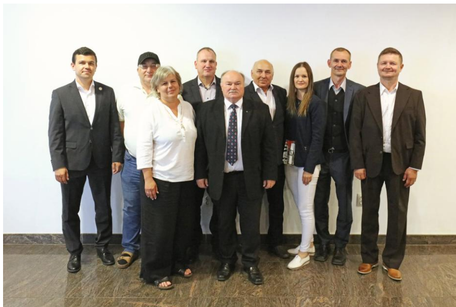
Výkonný výbor Slovenského stolnotenisového zväzu zvolený Konferenciou SSTZ v roku 2025.

Zvolením orgánov na nové funkčné obdobie bola zabezpečená kontinuita činnosti Slovenského stolnotenisového zväzu a vytvorené podmienky na pokračovanie strategických projektov a ďalší rozvoj stolného tenisu na Slovensku.