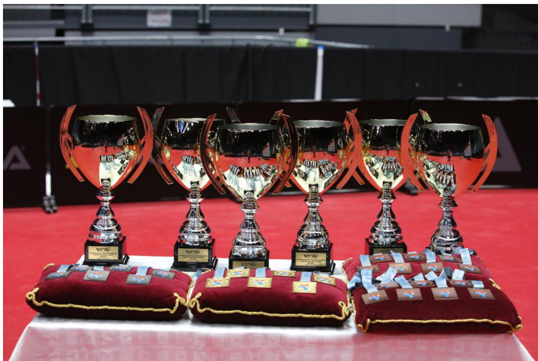
Majstrovstvá Európy do 21 rokov v Bratislave – poháre a medaily

Činnosť SSTZ nemá žiadne významné negatívne vplyvy na životné prostredie. Zväz sa vo svojej činnosti usiluje o efektívne a zodpovedné hospodárenie, podporu udržateľnosti športových podujatí a ochranu životného prostredia.