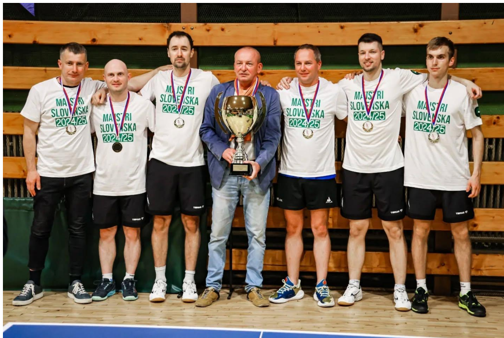
TJ Geológ Rožňava – majster Slovenska družstiev mužov v sezóne 2024/2025.