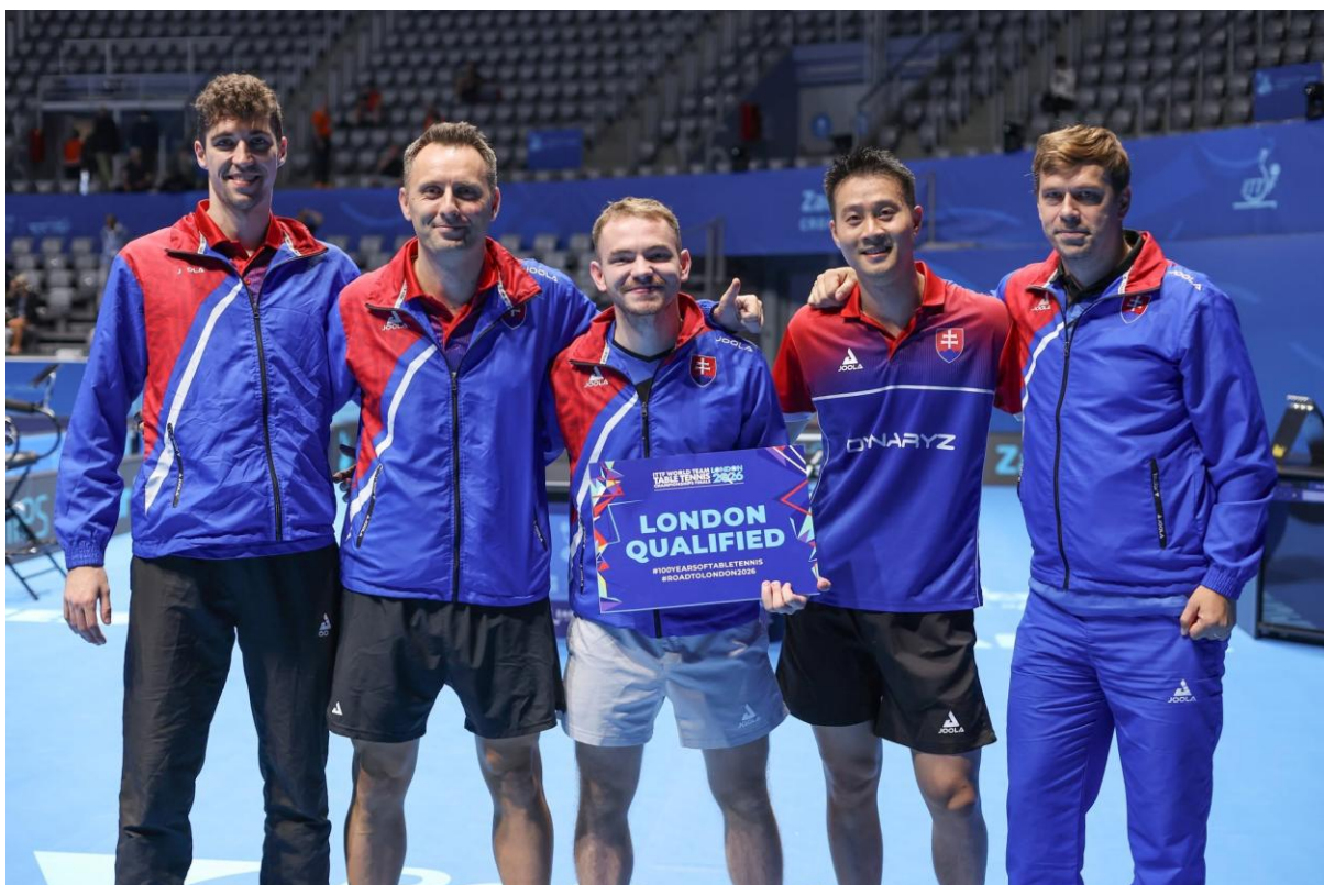
Slovenské reprezentačné družstvo mužov si na Majstrovstvách Európy družstiev 2025 v Zadare vybojovalo postup na Majstrovstvá sveta družstiev 2026 v Londýne

5. 2025 Joola EYS Serbia Open, Beočin, Srbsko, 26.-30.11.2025