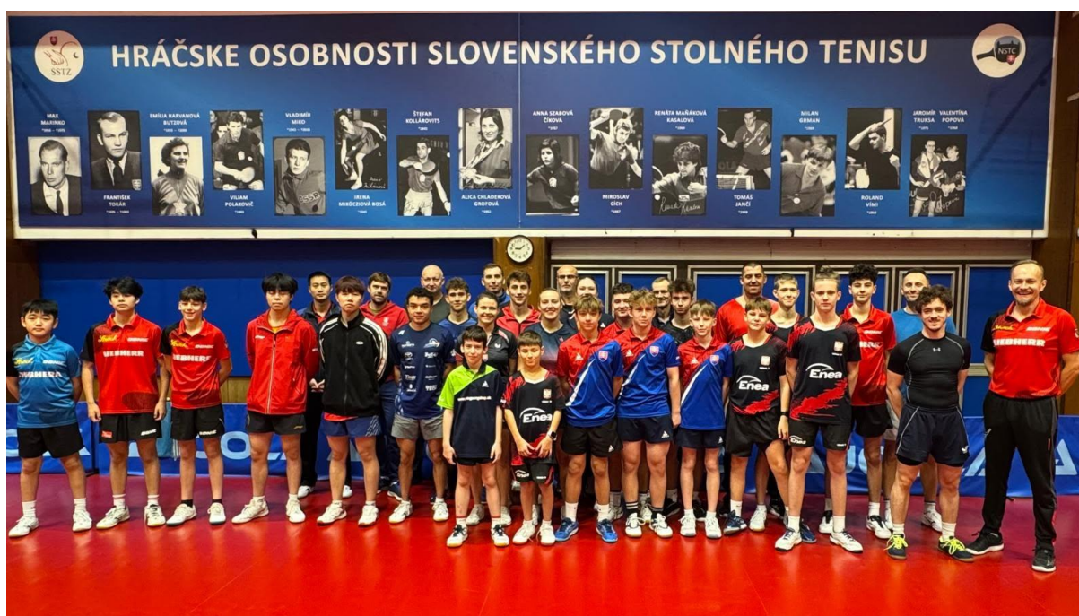
Národné stolnotenisové centrum v Bratislave pravidelne hostí medzinárodné tréningové kempy a sústreďenia mládeže.

Slovenský stolnotenisový zväz počas celého účtovného obdobia vykonával svoju činnosť v súlade s platnými Stanovami SSTZ, vnútornými predpismi zväzu a všeobecne záväznými právnymi predpismi Slovenskej republiky