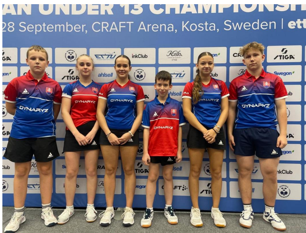
Slovenská výprava na Majstrovstvách Európy hráčov do 13 rokov 2025 v Koste (Švédsko)