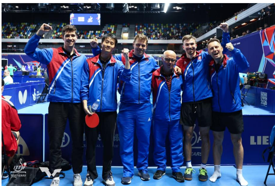
Slovenská mužská reprezentácia s realizačným tímom počas majstrovstiev sveta.