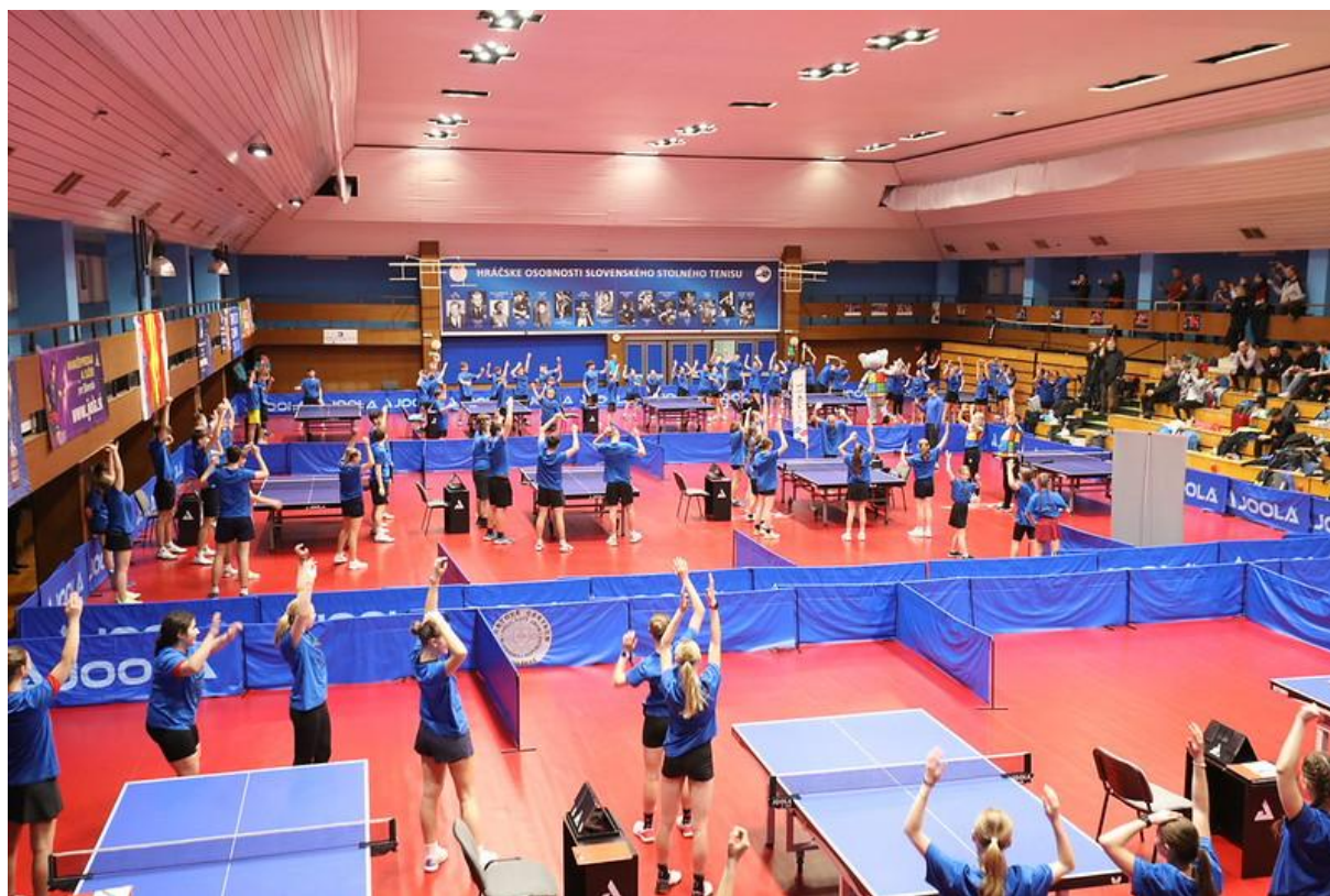
SUPERfinále školského športu 2025 v stolnom tenise sa uskutočnilo v Národnom stolnotenisovom centre v Bratislave-Rači.