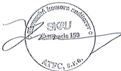
ATFC, s.r.o., Bratislava Licencia SKAu č. 150