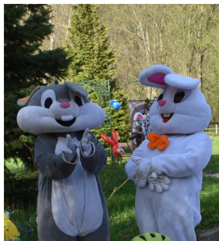
▪ No počkaj, Zajac