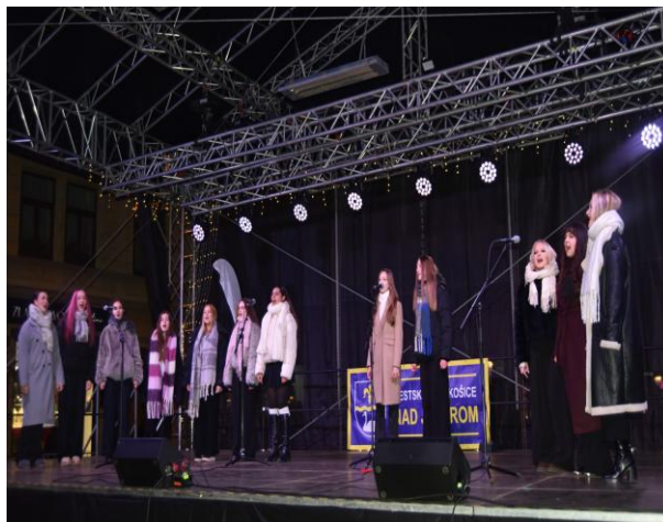
▪ Vianoce v meste