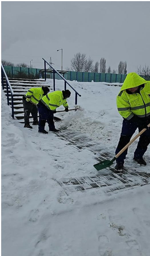
▪ Zimná údržba