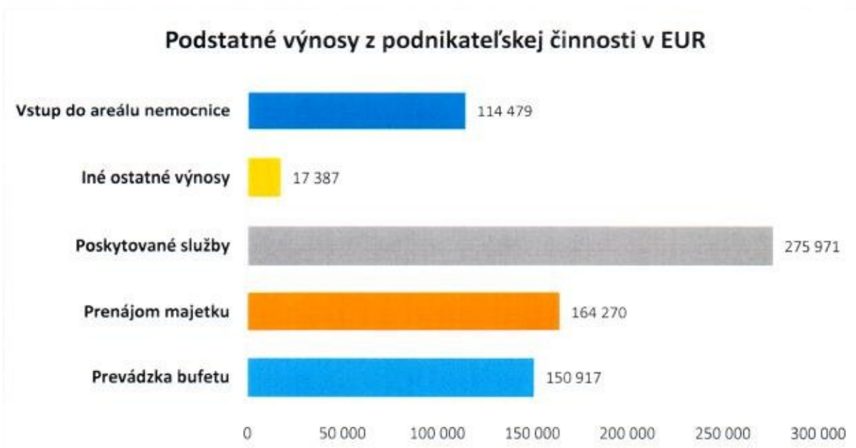
Graf 2 Prehľad podstatných výnosov z podnikateľskej činnosti

V rámci podnikateľskej - zdaňovanej činnosti organizácia dosiahla zisk po zdanení vo výške 41 140,71 EUR.