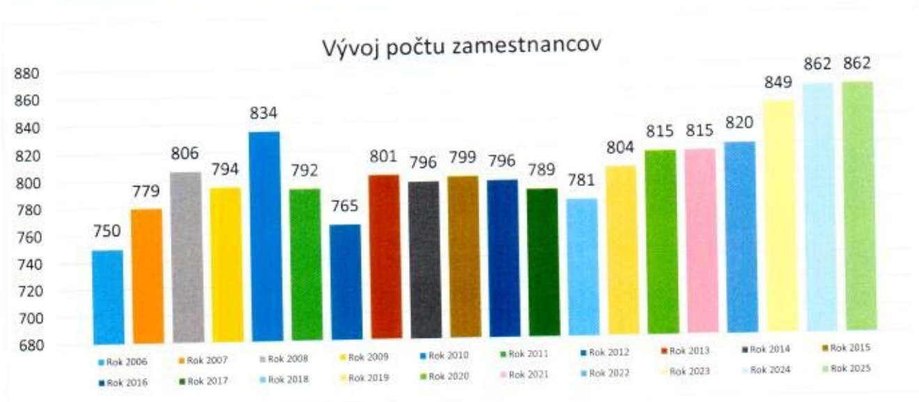
Graf 1 Vývoj počtu zamestnancov vo VŠNsP Lučenec n.o.

V roku 2025 VŠNsP Lučenec n.o. poskytovala všeobecnú a špecializovanú ambulantnú starostlivosť v 36 ambulanciách. Zabezpečovala rôzne vyšetrenia a zdravotnú starostlivosť na piatich oddeleniach spoločných vyšetrovacích a liečebných zložkách a prevádzkuje ambulantnú dopravnú zdravotnú službu. Má zriadené pracovisko funkčnej diagnostiky, centrálné operačné sály, centrálnu sterilizáciu a Agentúru domácej ošetrovateľskej starostlivosti.