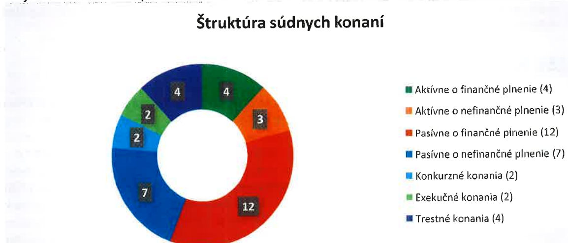
Graf č. 2: Štruktúra súdnych konaní

Spoločnosť MH Manažment, a. s. vedie databázu prebiehajúcich a ukončených súdnych sporov, pričom ku dňu 31.12.2025 bola účastníkom konania v 34 súdnych konaniach. Z nižšie priloženého grafu vyplýva štruktúra súdnych konaní. Z celkového počtu 34 súdnych konaní bola spoločnosť MH Manažment, a. s. účastníkom v 4 trestných konaniach v postavení poškodeného, v 2 konkurzných konaniach v postavení veriteľa, v 2 exekučných konaniach (v postavení oprávneného) a v neposlednom rade aj v 26 sporových súdnych konaniach, v ktorých má spoločnosť MH Manažment, a. s. buď postavenie žalobcu (7 súdnych konaní) alebo postavenie žalovaného (19 súdnych konaní).