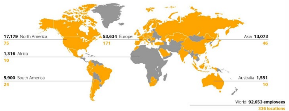
336 locations in 54 countries and markets

Skupina Continental je v súčasnosti rozdelená do 2 sektorov – Tires a ContiTech .