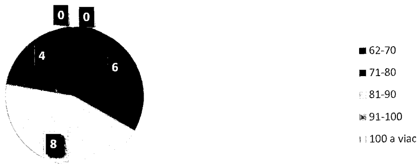
Graf 2 Vekové hranice prijímateľov sociálnych služieb