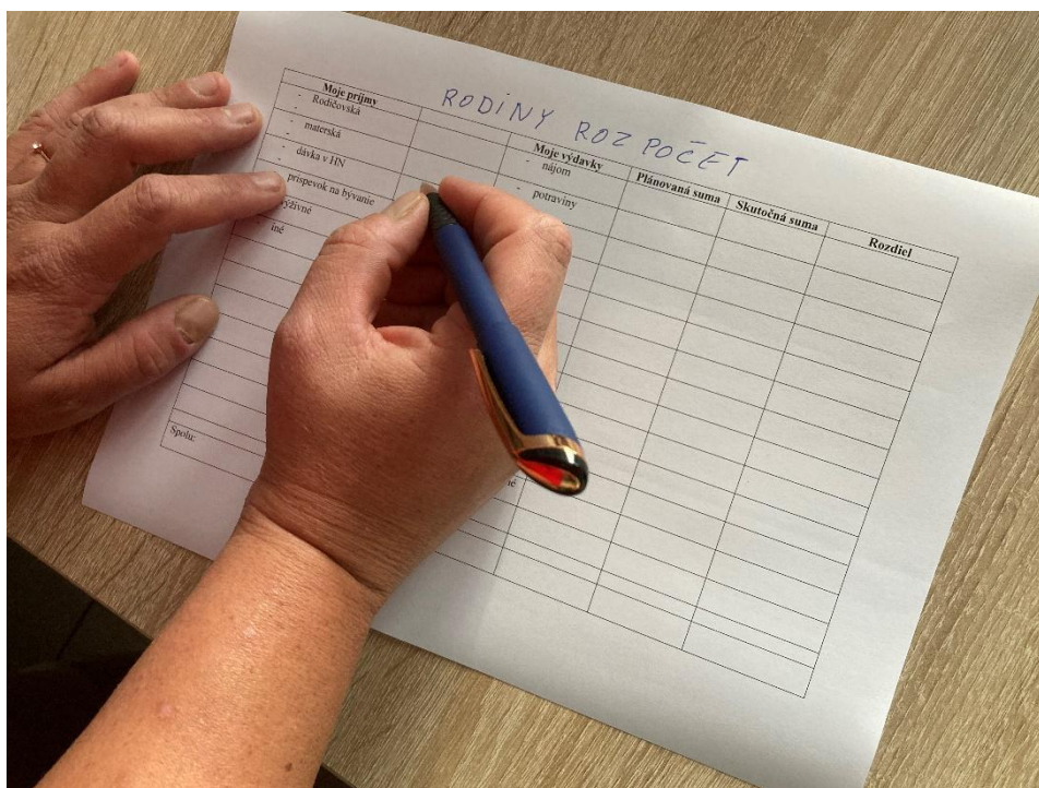
Obr. 2 Príprava rodinného rozpočtu