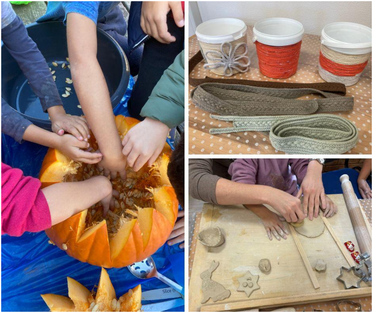
Obr. 3 Relax a zábava