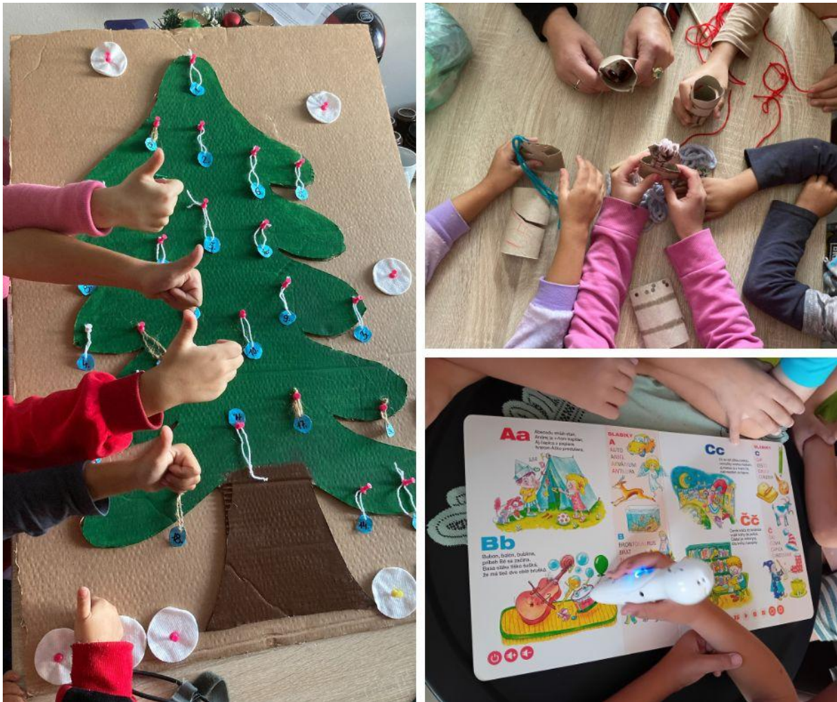
Obr. 1 Mamky trávajú čas so svojimi deťmi