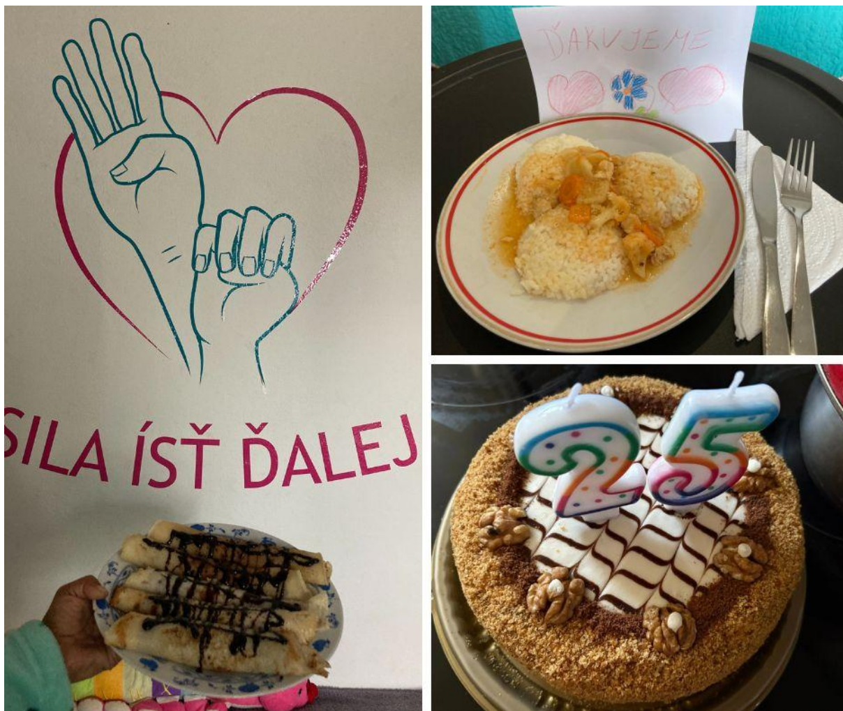
Obr. 5 Varím, variš, varíme a pečieme