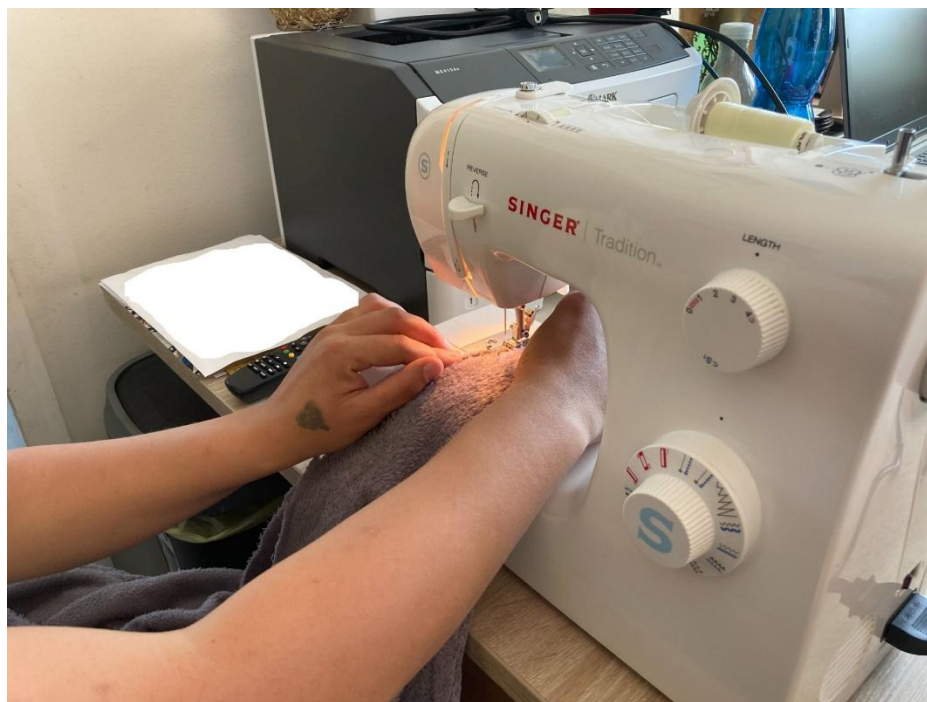
Obr. 4 Výroba hrejivej deky