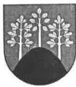
Erb obce Michalková