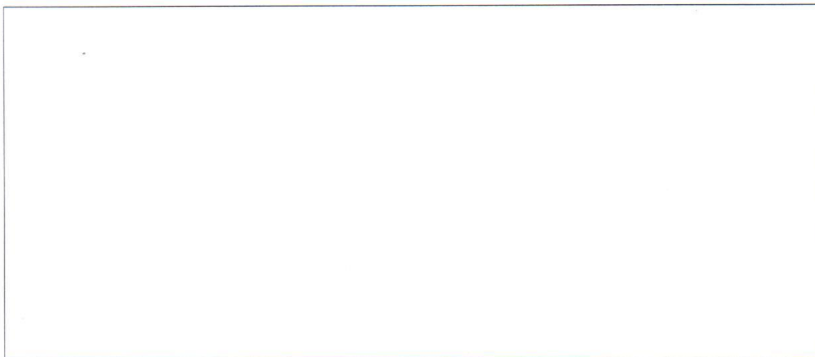
Tabuľka č. 2