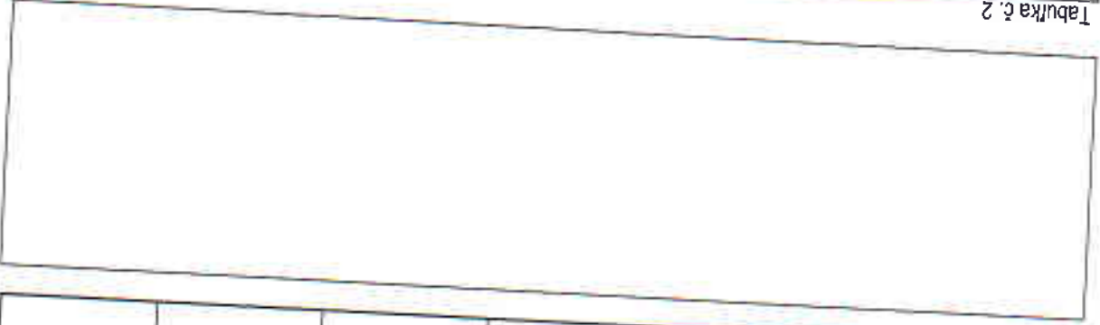
Tabuľka č. 2

Bezprostredne predchádzajúce účtovné obdobie