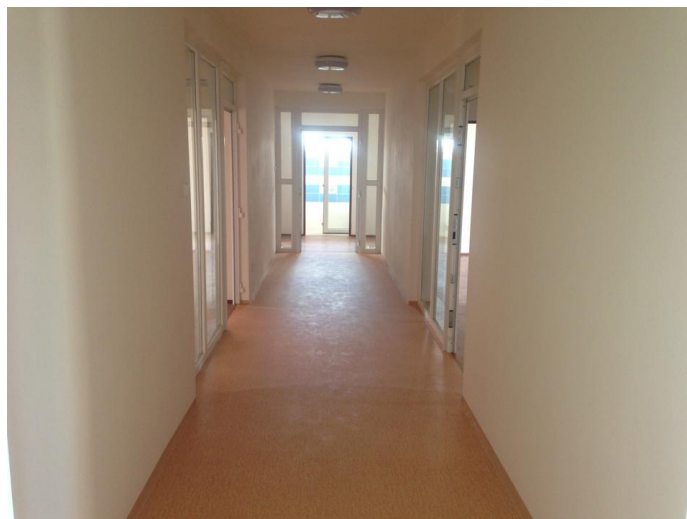
Obr. 6 Priestory v novej budove pred kolaudáciou