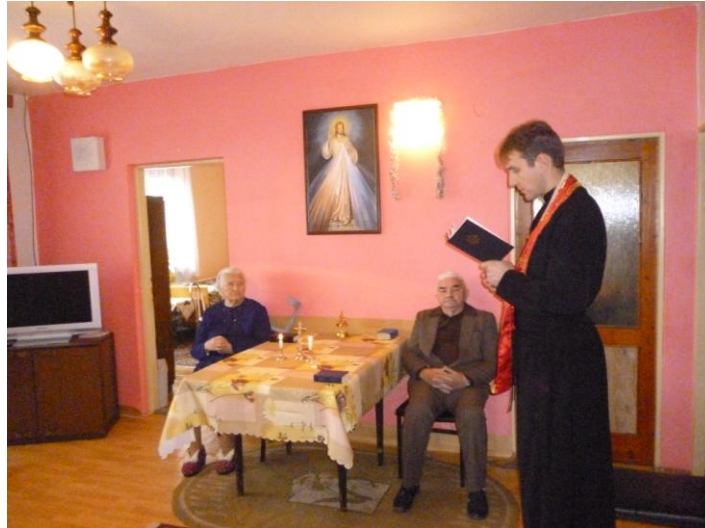
Obr. 5 Spoved'

Už pri prvom kontakte s klientom a jeho rodinou spolupracuje naša sociálna pracovníčka, ktorá spracúva informácie o jeho sociálnej a zdravotnej situácii a spoločne sa snažia nájsť čo najlepšie riešenie jeho situácie. Ak je umiestnenie klienta v našom zariadení preňho najlepšou alternatívou spolu s ostatnými zamestnancami sociálna pracovníčka pre neho vytvára čo najideálnejší program, aktivity a napomáha mu pri procese adaptácie.