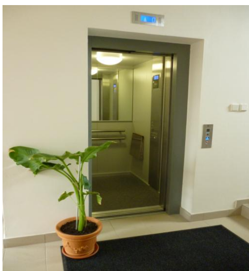
Obr. 2 Výťah

V roku 2013 sme dokončili rekonštrukciu a prístavbu s ktorými sme začali už v roku 2011. Vďaka tejto rekonštrukcii sa zvýšila nielen kapacita nášho zariadenia, ale tiež aj kvalita nami poskytovaných služieb a to aj vďaka vybudovaniu výťahu, ktorý umožňuje bezbariérový pohyb našim klientom po celej budove.