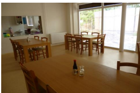
Obr. 4 Nová jedáleň

Výdaj jedla sa uskutočňoval v novootvorenej jedálni.