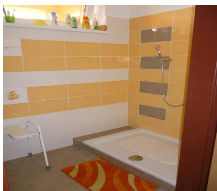
Obr. 3 Kúpeľňa

V novootvorenej časti nám pribudlo 12 izieb bunkového typu, kde každá bunka má svoje vlastné sociálne zariadenie. Izby sú jedno a dvojposteľové vybavené novým nábytkom a každá izba má aj balkón.