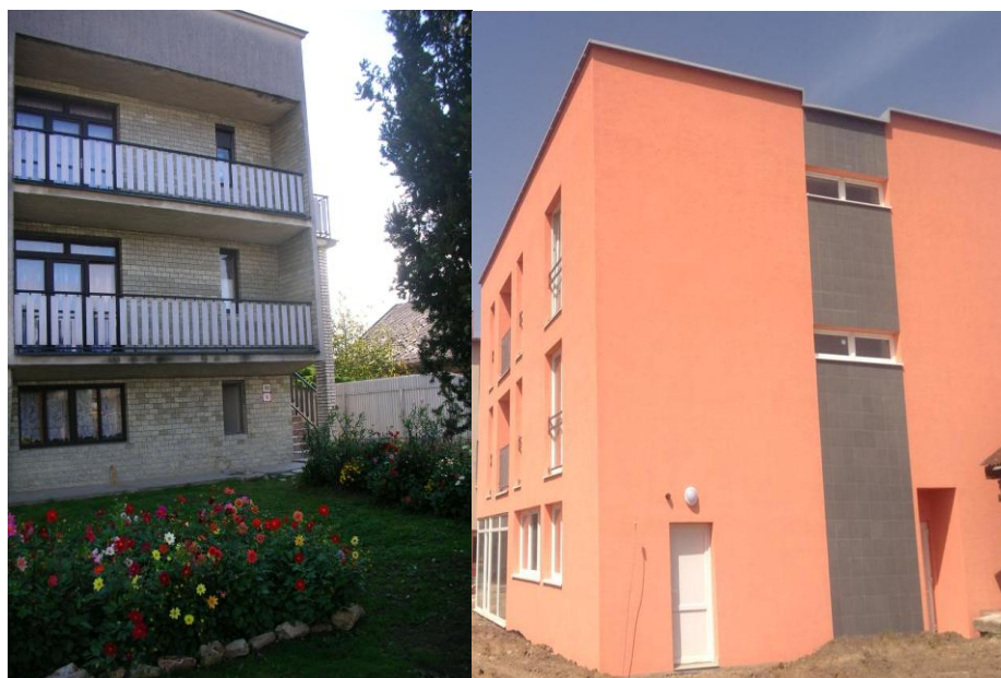
Obr. 1 Pôvodná budova a nová budova kolaudovaná v r. 2013

DD TEREZA n. o. je týmto zaradená do databázy ako organizácia pôsobiaca v oblasti sociálnych služieb.