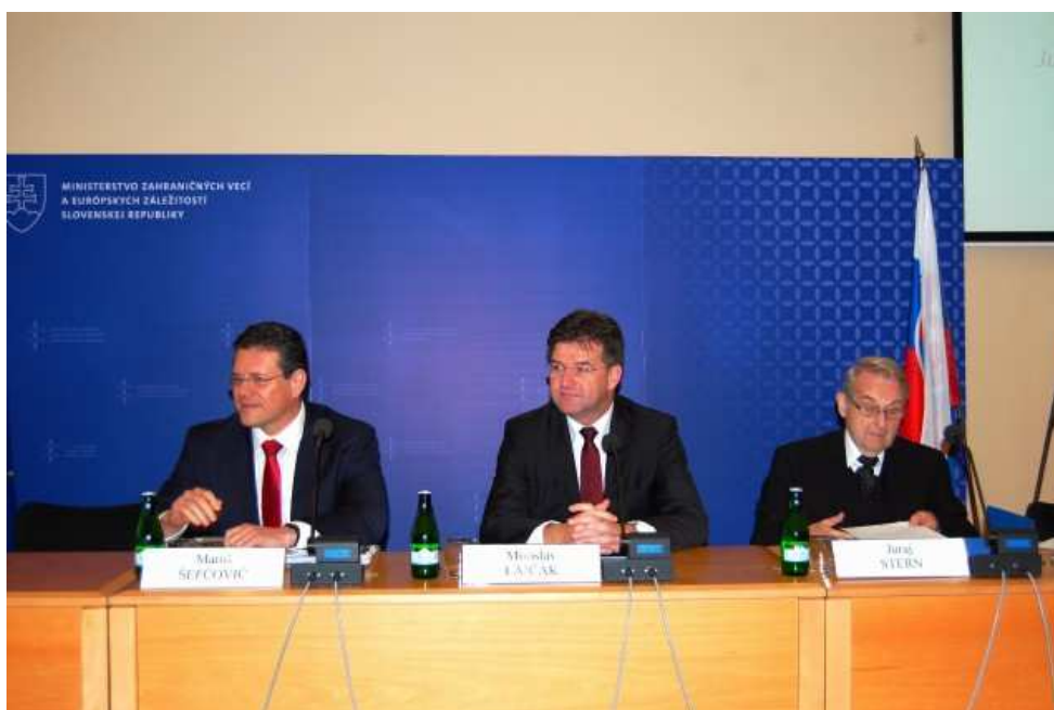
Medzinárodná konferencia „EÚ v roku 2013: Ako obnoviť dôveru a rásť?“, Bratislava, 31. 5. 2013