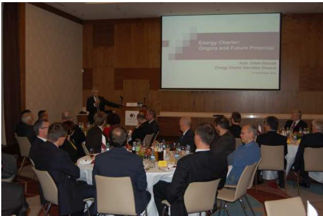
Energetická politika EÚ a energetická bezpečnosť strednej Európy. Stredoeurópska energetická konferencia (CEEC VII), Bratislava, 24. – 26. 11. 2013