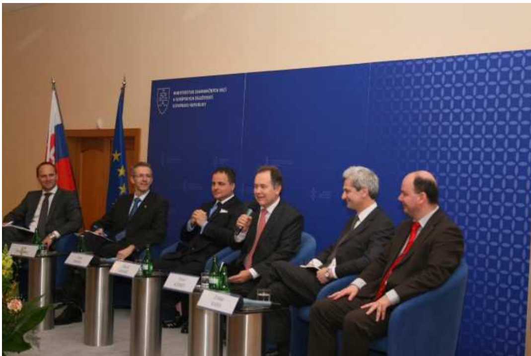
XIV. ročník Hodnotiacej konferencie zahraničnej a európskej politiky Slovenskej republiky za rok 2012, Bratislava, 26. 3. 2013