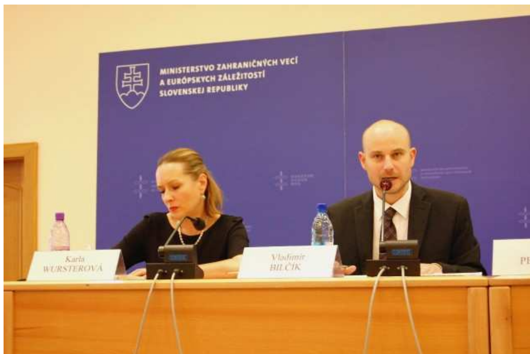
Medzinárodná konferencia „Východné partnerstvo: čo po summite vo Vilniuse“, Bratislava, 22. 10. 2013