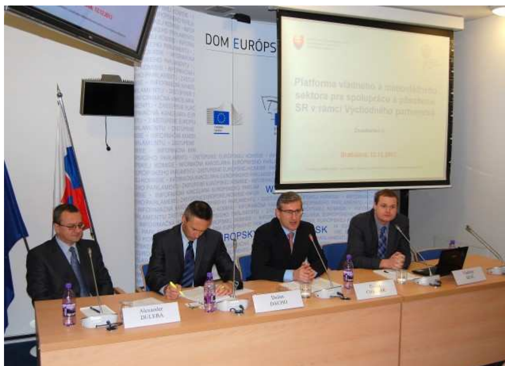
Zasadanie platformy vládného a mimovládneho sektora pre spoluprácu a pôsobenie SR v rámci Východného partnerstva, Bratislava, 12. 12. 2013