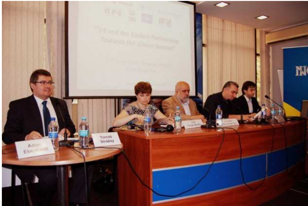
Medzinárodná konferencia „V4 a Východné partnerstvo: pred summitom vo Vilniuse“, Odesa, 17. 6. 2013