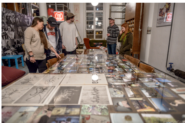
Urban Art Session vol. 3: kultúra mestského umenia