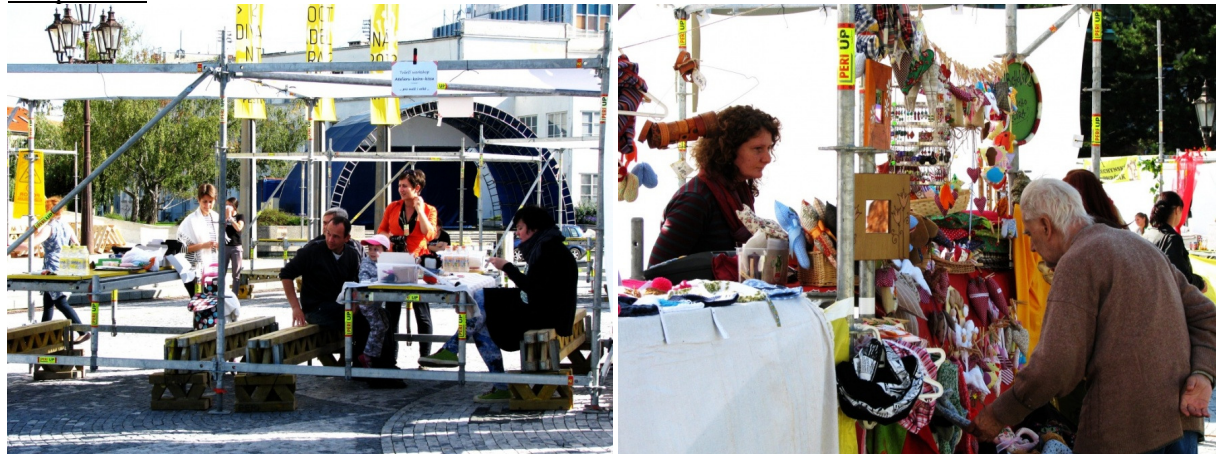
Fest Market 2013