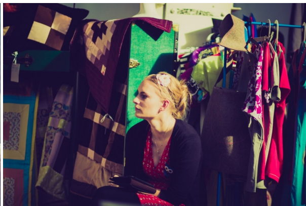
Urban Market 2013 (Spring Edition) / súčasťou Dni Architektúry A Dizajnu - DAAD