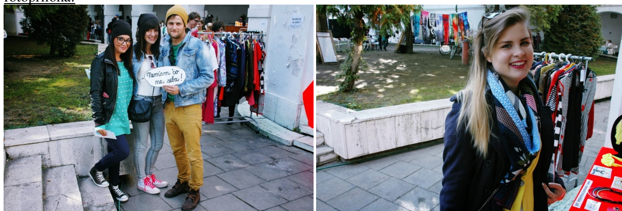
BLAF Market 2013