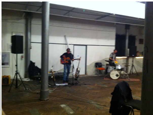
SINGULARch / RAUM (FR)