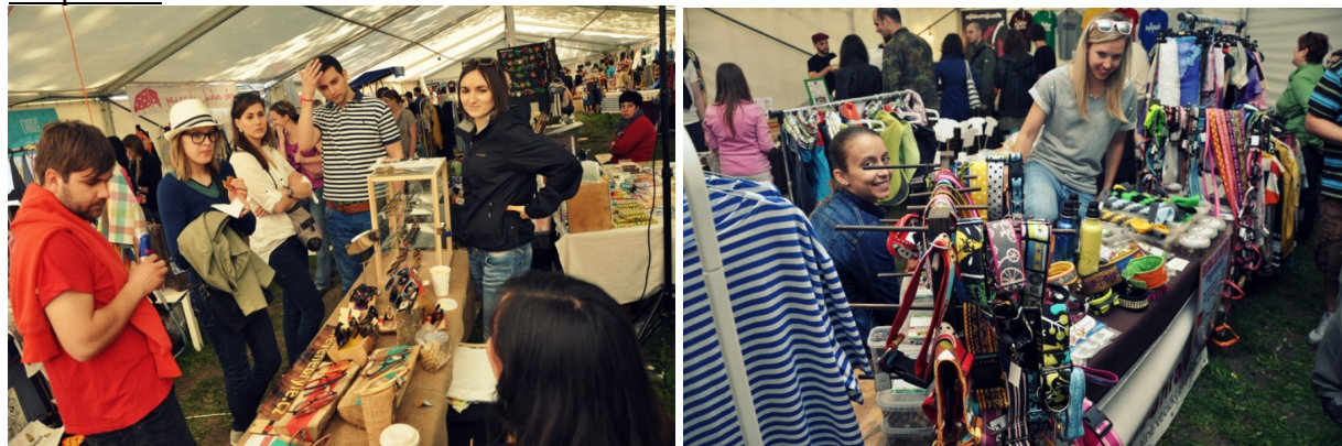
SAShE Art Picnic 2012 / v rámci Bratislavského majálesu 2012 // Tyzršovo nábrežie, Bratislava