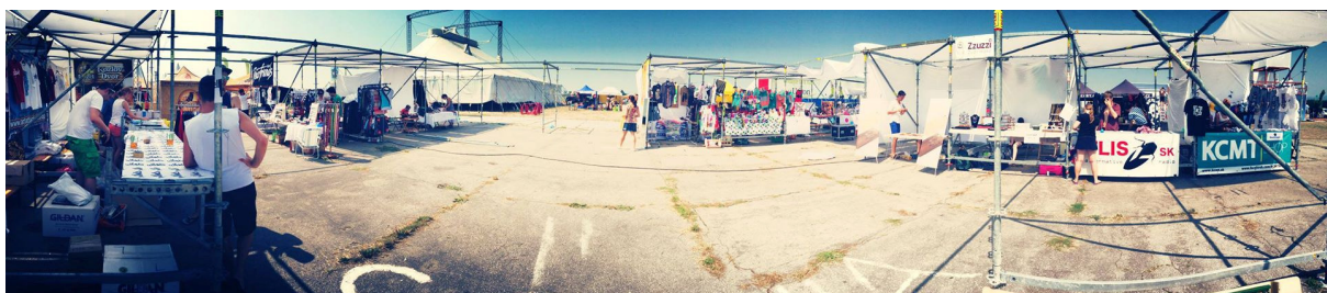
Urban Market 2013 (Summer Edition) / Urban Market Zóna na Festivale GRAPE 2013