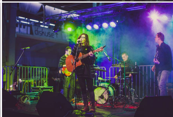
Urban Market 2013 (Winter Edition)

Čerstvé Ovocie, n.o. Hviezdoslavovo nám. 9, 811 02 Bratislava, Slovenská republika