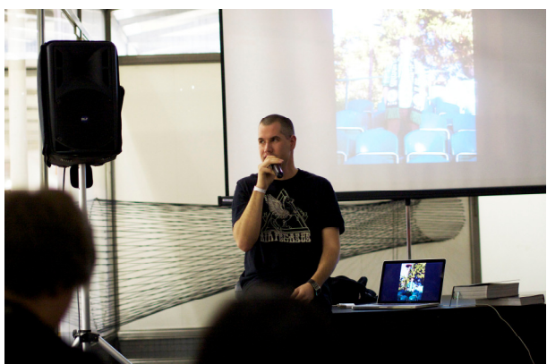
Urban Art Session vol. 4: kultúra mestskej módy