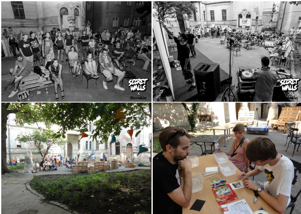
Pekná Maľba II.