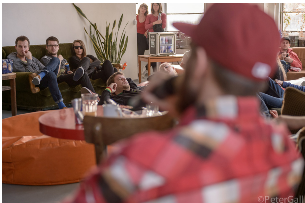
Urban Art Session vol. 2: kultúra mestskej hudby