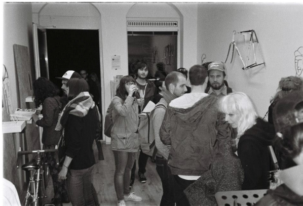
Urban Art Session vol. 1: kultúra mestskej cyklistiky