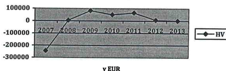
Vývoj hospodárskeho výsledku podľa rokov

Spoločnosť dosiahla k 31.10.2013 tržby z predaja služieb vo výške 1 725 911 eur. Najvýznamnejšou položkou v tržbách z predaja služieb bolo poskytovanie poradenstva v oblasti ekonomiky, účtovníctva, financií, personalistiky a IT technológií vo výške 1 711 840 eur a ostatných služieb vo výške 14 071 eur. V oblasti nákladov na hospodársku činnosť spoločnosť v roku 2013 vo významnej miere čerpala osobné náklady vo výške 233 116 eur. V oblasti nákladov na finančnú činnosť najvýznamnejšou položkou sú náklady na úroky vo výške 1 280 757 eur.