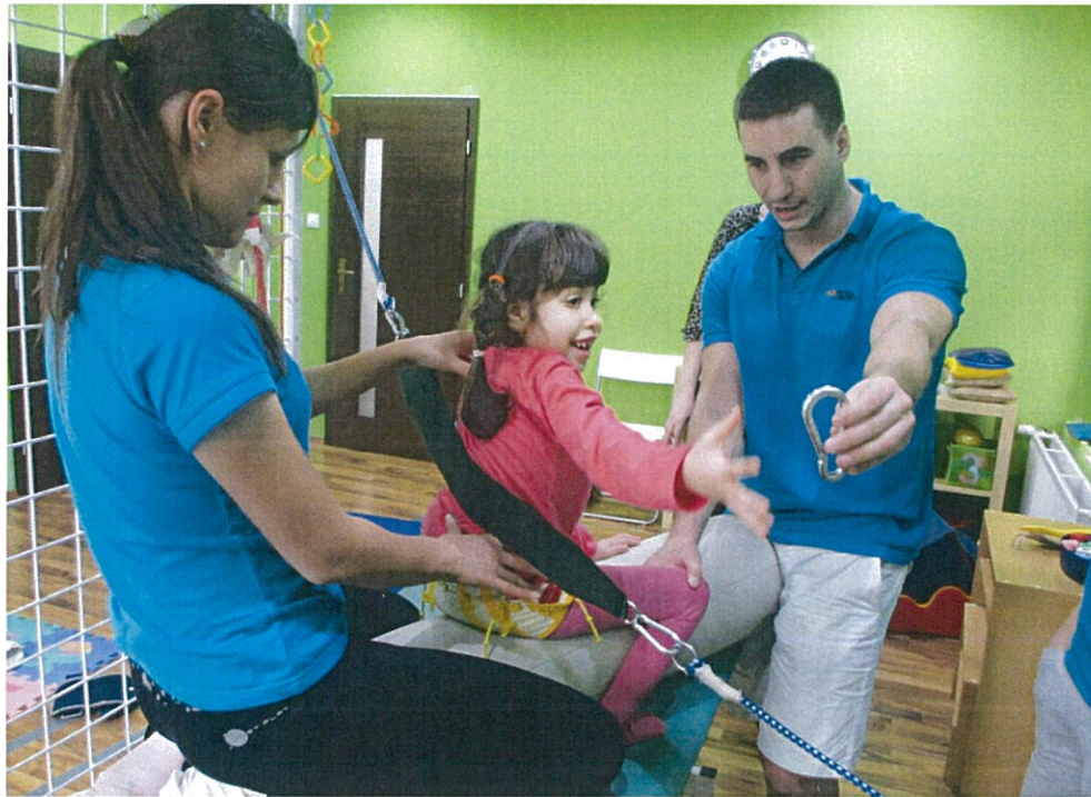
ŠPECIÁLNY DETSKÝ VOZÍK OTTO BOCK RACER.