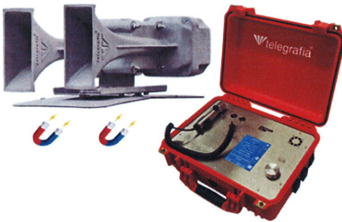
Obrázok 2 Pavian CAR

a nezávislú sirénu BONO, ktorú je možné použiť v exteriéri aj interiéri, v priemyselných areáloch a halách, hlučných prevádzkach, povrchových baniach, na verejných priestranstvách a podobne.