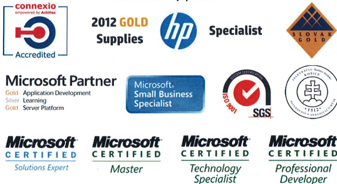
Obrázok 1 Ocenenia a certifikáty spoločnosti

Naša spoločnosť ako jediná v Slovenskej a Českej republike ponúka kurz s vlastným certifikovaným lektorom v slovenskom jazyku s využitím anglickým pojmov