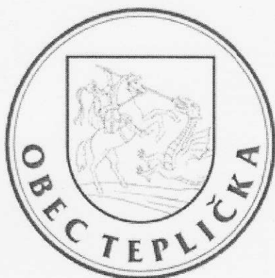
Pečať obce :