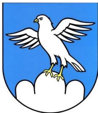
Obr. 1 Erb obce Bodovce