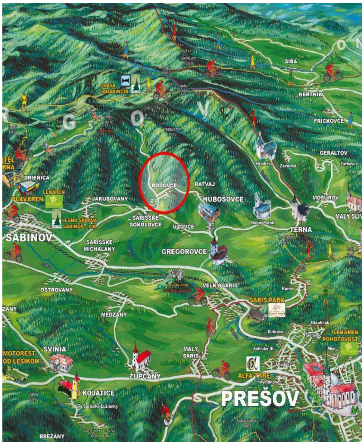
Obrázok č. 1 : Mapa

Najbližšie letisko je v Košiciach – 60,1 km. Okresné mesto Sabinov je od stredu obce vzdialené 7,7 km a krajské mesto Prešov je od stredu obce vzdialené 16,8 km.