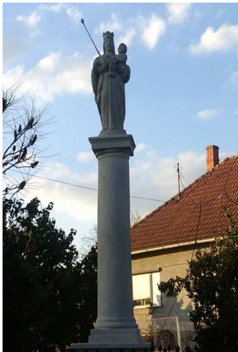
Mariánsky barokový stĺp

Umelecké pamiatky obce Host'ovce sú Mariánsky barokový stĺp a kostol Povýšenia Svätého Kríža .