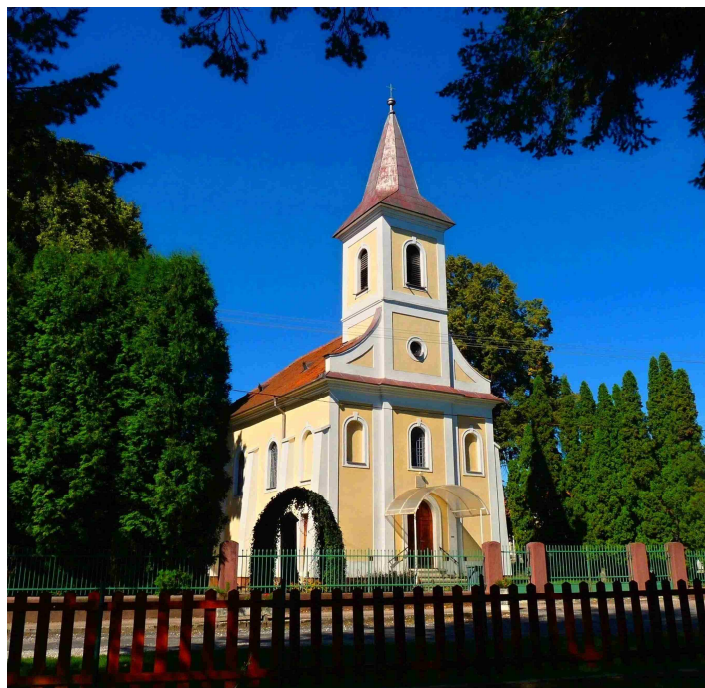
kostol Povýšenia Svätého Kríža

Významné sú aj rôzne archeologické nálezy . Napríklad nájdený denár kráľa Kolomana (1098-1114) z roku 1950. V roku 1960 sa pri výstavbe budov JRD narazilo na slovanské pohrebisko z XI.-XII.storočia.