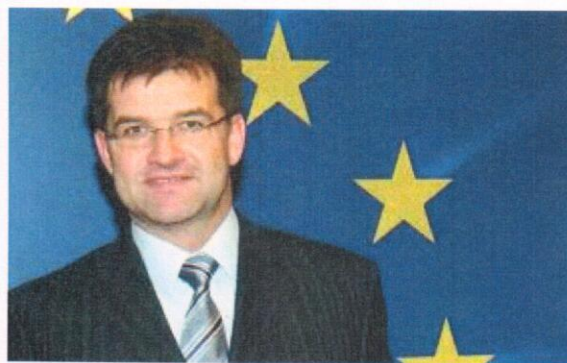
JUDr. Miroslav Lajčák Minister zahraničných vecí a európskych záležitostí Slovenskej republiky