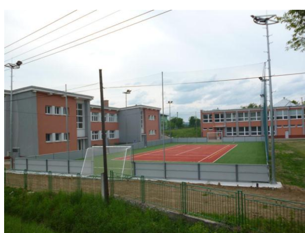
ZŠ Kotešová, multifunkčné ihrisko