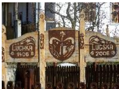
Pamätná tabuľa pri príležitosti 600 rokov od prvej zmienky