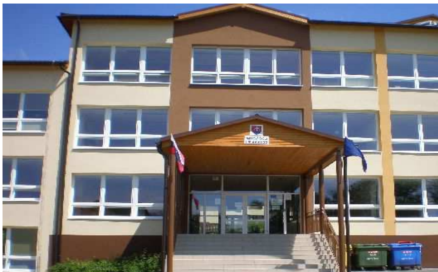
Materská škola Čierne Ústredie