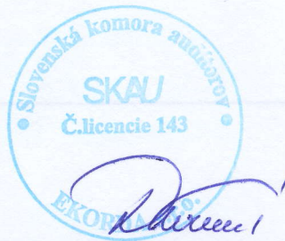
E K O R D A, s.r.o. Révová 45, Bratislava Licencia SKAU 143