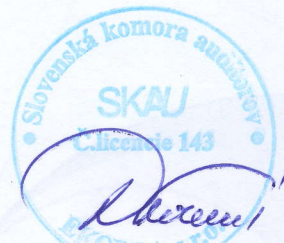
E K O R D A, s.r.o. Révová 45, Bratislava Licencia SKAU 143