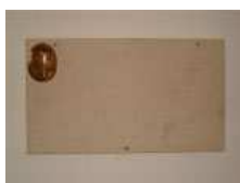
Pamätná tabuľa sa nachádza v predsieni Evanjelického kostola v Nécspaloch