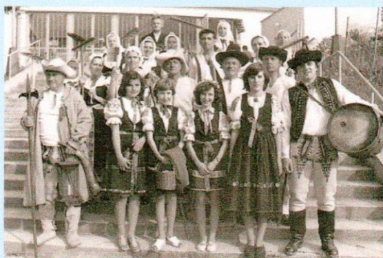
Dožinky-Folklórny súbor Ledničanka

Obec Lednica je známa aj svojím kultúrnym životom. Zachovávajú sa tu tradičné zvyky, napr. Fašiangy, Tri krále či Veľká noc. V spolupráci s folklórnou skupinou sa každoročne usporadúvajú Dožinkové slávnosti spojené s tradičným jarmokom, pripravuje sa pre deti športový deň na Deň detí, Posedenie s dôchodcami, Vianočný koncert v kostole, a pod. Okrem snahy o zachovanie a udržanie starých zvykov sa folklórna skupina úspešne prezentuje aj vystúpeniami na rôznych kultúrnych podujatiach po celom okolí i na blízkej Morave.