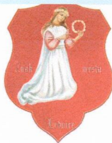
Erb obce Lednica