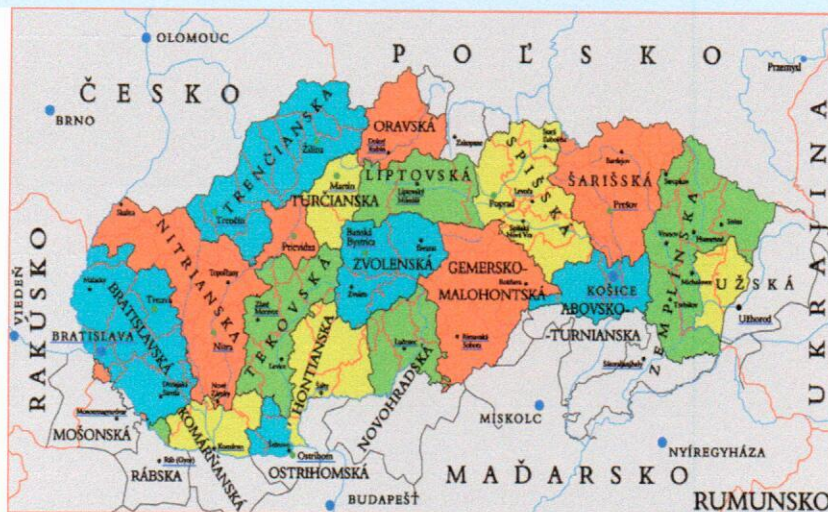
Mapa stolic 1785-1790