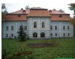
Stav v roku 2002

Dátum vzniku tohto kaštieľa nie je presne známy, z hľadiska stavebného vývoja a slohového zaradenia sa jedná o budovu, ktorá vznikla zo staršej renesančnej stavby, datovanej do 17. storočia, prestavanej a prefasádovanej v 2. polovici 18. storočia do dnešnej barokovo-klasicistickej podoby.