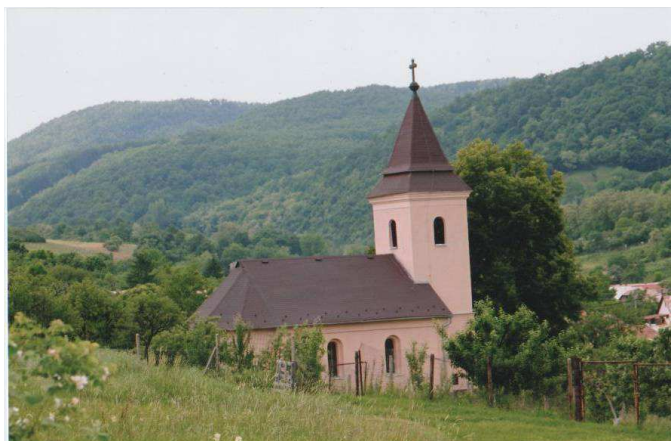
evanjelický kostol postavený z roku 1874