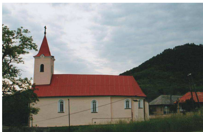
rímskokatolícky kostol z roku 1535