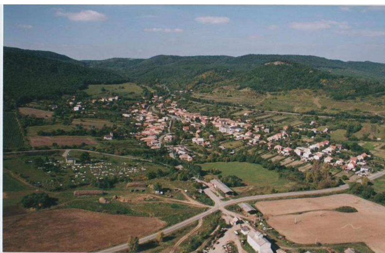
Letecký pohľad na obec Kosihovce

Obec leží 17 km od susednej hranice maďarskej republiky.